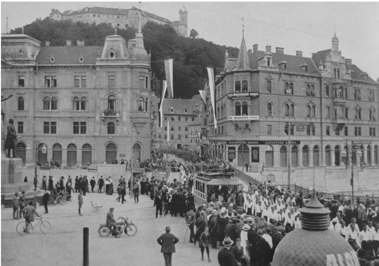
Povorka v središču Ljubljane (v: Spomenica)

obveznost v vojaških enotah v Zagrebu, Osijeku, Bakru, Varaždinu, Čakovcu, Splitu, Ptuj in Celju in pripadniki podoficirske šole iz Zagreba. Iz Tivta je prispelo 80 mornarjev, iz Boke Kotorske pa 130 vojakov mornarjev, večinoma Slovencev, ki so tam služili svoj vojni rok. Vagone za prevoz vojaštva so okrasili z napisi “ Ko Sloven taj Sokol”. Nastanili so jih v kasarni “Vojvoda Mišić”. Ko so korakali po mestu so vojaki peli, samo za to priliko napisano pesem, “Pozdravljena Slovenija”. 21 Tudi oni so imeli glavni preizkus nastopa 5. avgusta.