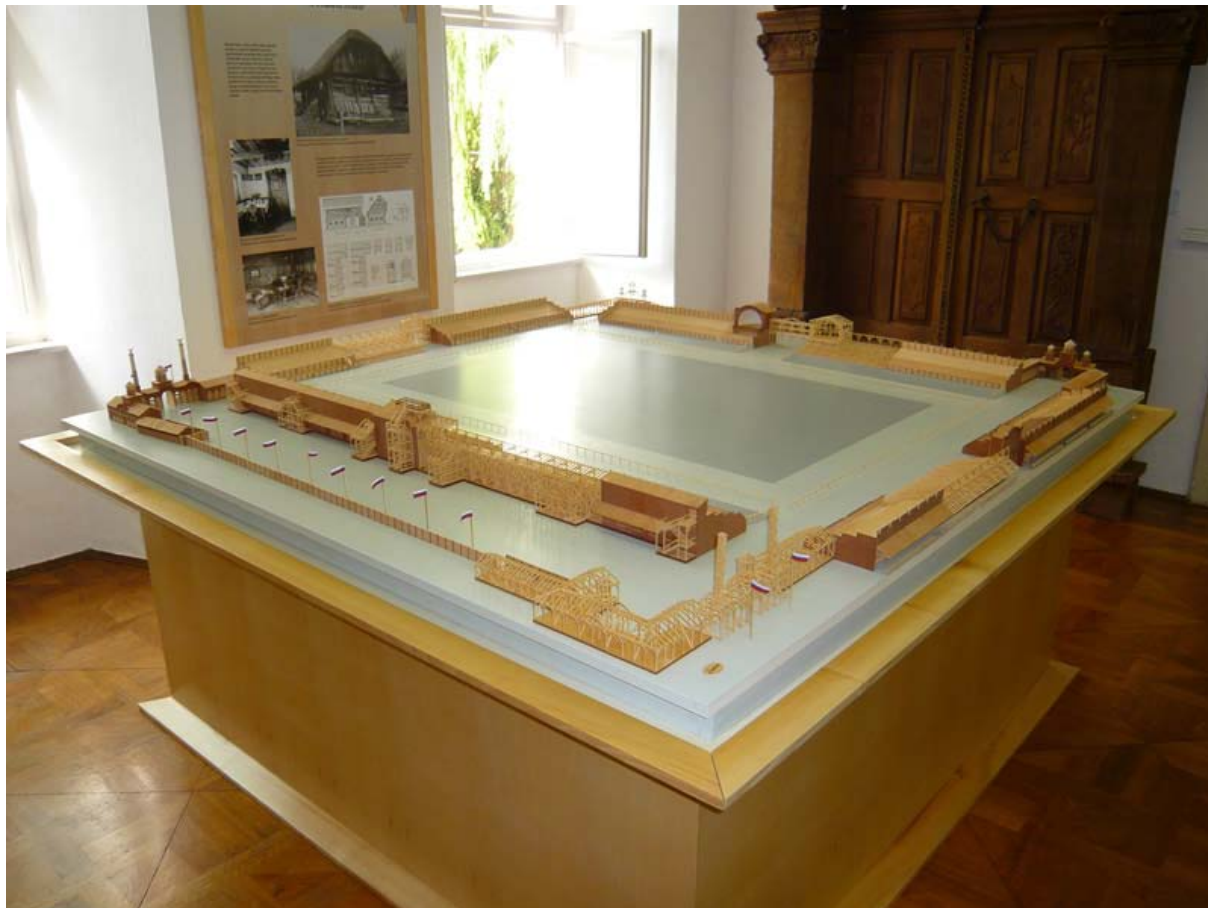
Maketa stadiona v stalni zbirki TMS

ušesih še zvenijo doneči zvoki poživljajoče sokolske koračnice, ki jo vsi poznamo in ljubimo. Jako smo izmučeni, ampak zadovoljni z uspehi – in pet natarjev najbolj priljubljenih kavarn v Ljubljani je moralo v bolnico zaradi živčne oslabelosti...” 30