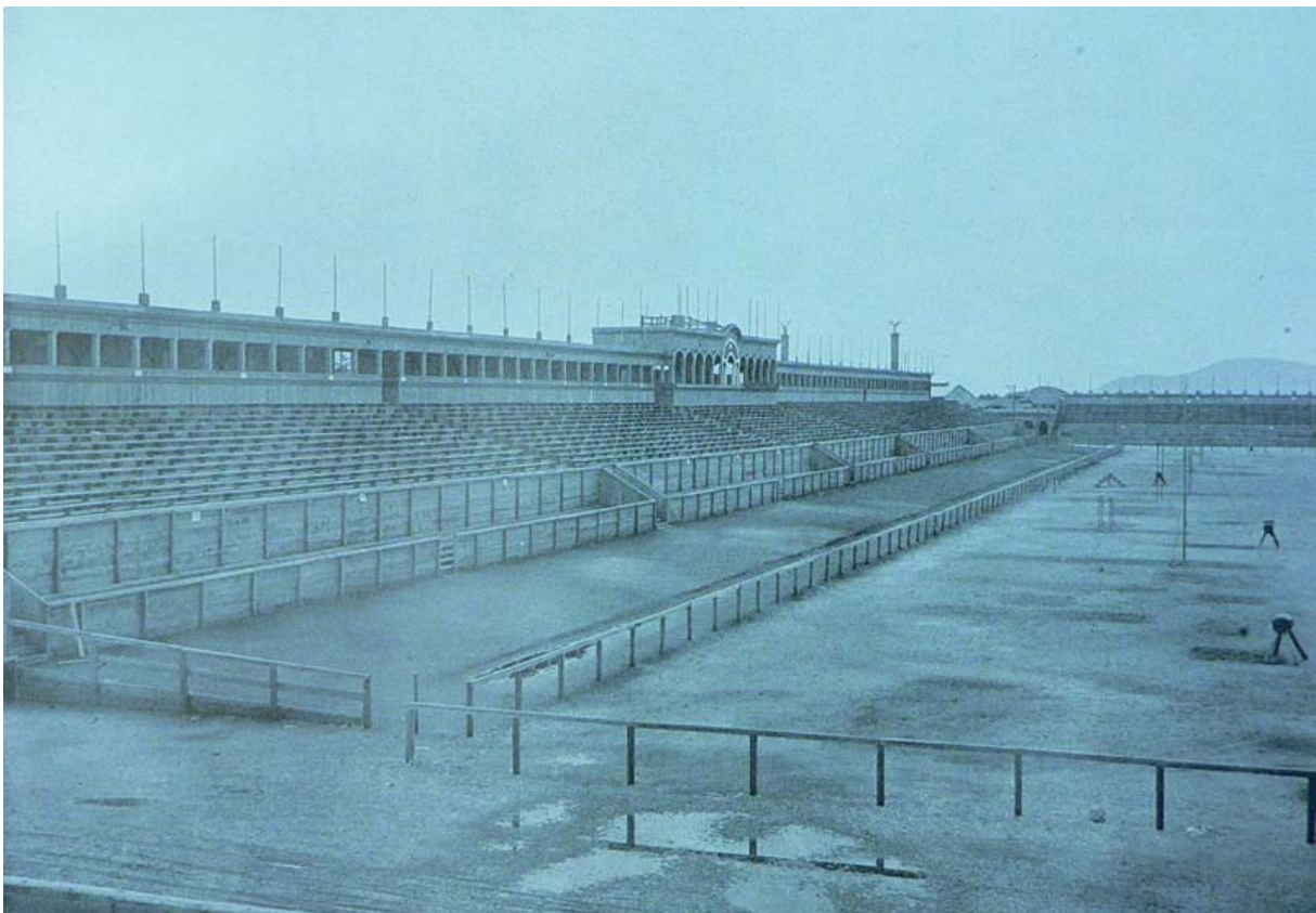
Zahodna oz. kraljeva tribuna (v: Spomenica)

rabila kot glavna promenada sokolov, telovadcev in gostov. Glavna vhoda sta bila povezana z blagajnami, pisarnami, poštnim uradom, policijskim uradom, okrepčevalnico in stranišči. Razen njiju sta bila na jugovzhodni in severovzhodni strani še dva stranska vhoda. V poštnem uradu na stadionu so oddali 1.550 pisem, 28.000 razglednic in 1.240 brzojavk, razen tega pa so prodali za 46.000 din poštne vrednotnic in opravili 150 plačanih telefonskih pogovorov.