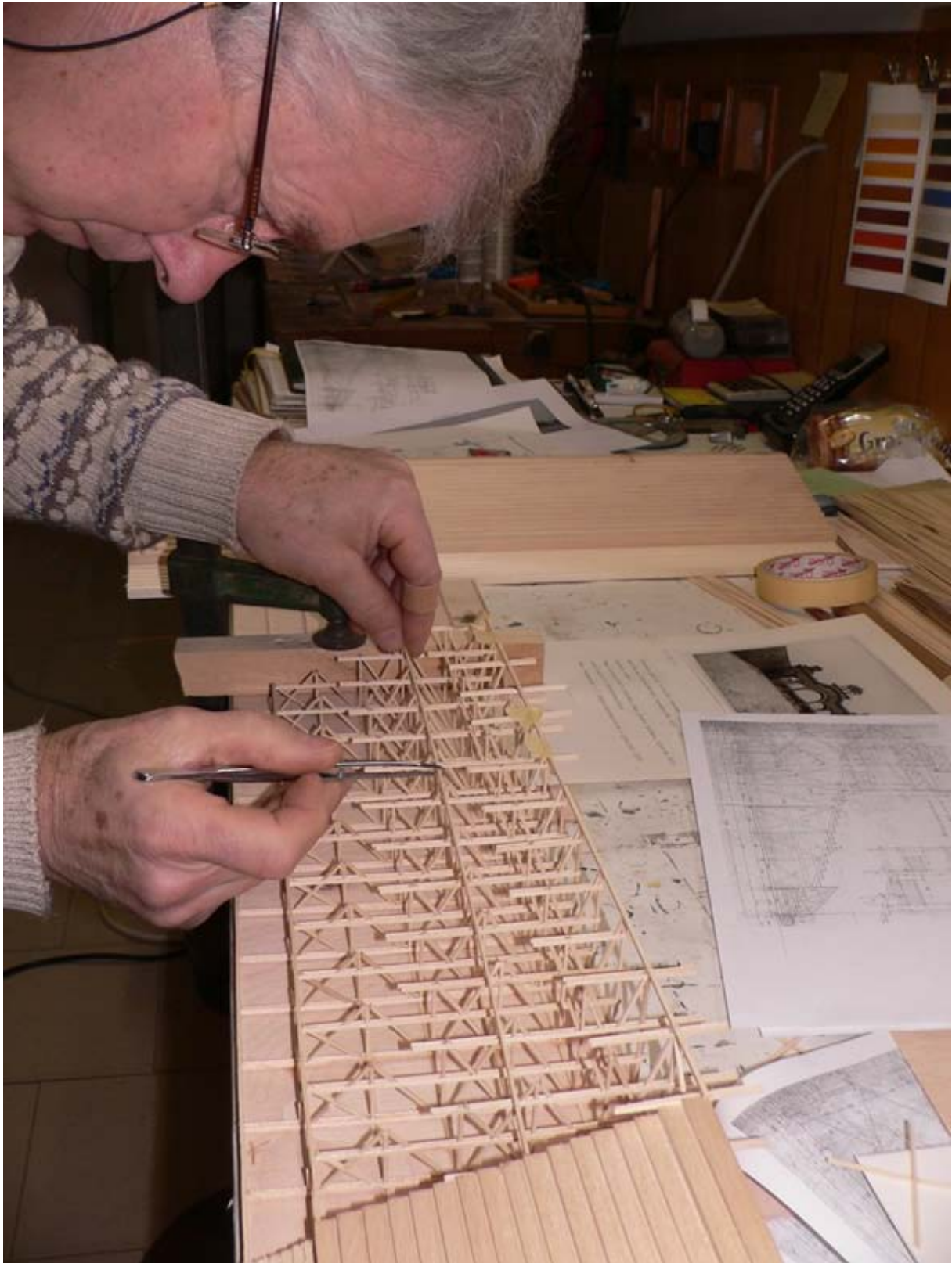
Izdelava konstrukcijske makete tribune