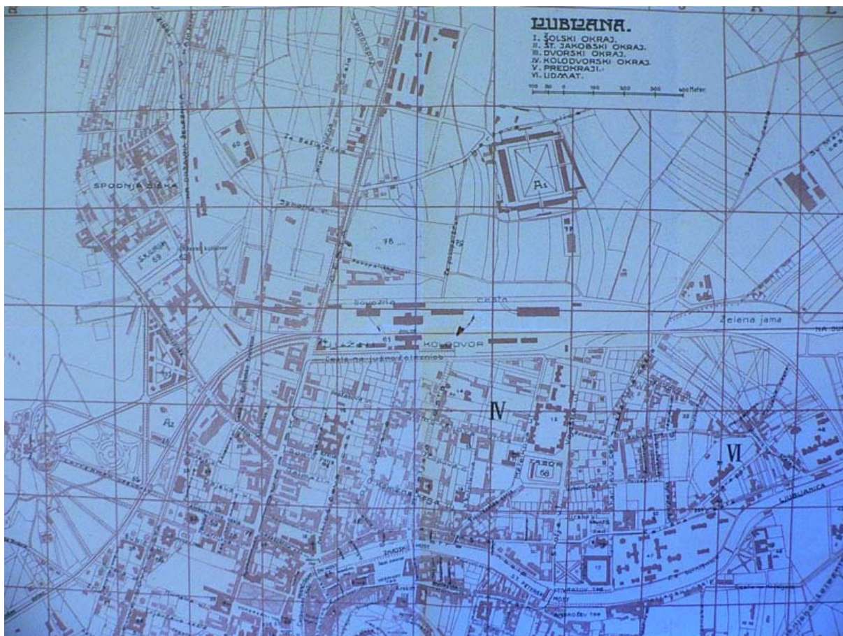
Lokacija stadiona (v: ZAL, LJU 489, Reg. I, fasc. 1880)

Gradbeni načrt stadiona je predvidel telovadišče kot njegov osrednji del. Dolgo je bilo 152 m in široko 105 m in je imelo padeč 5 promil. Dimenzije telovadišča so bile deljive s številom 1,9 kar je zadoščalo za 56 vzdolžnih in 81 prečnih linij, torej skupno za 4.536 telovadcev pri izvajanju prostih vaj. Vzdolž obeh daljših stranic telovadišča je bil zakoličen 15 m širok pas, vzdolž krajših stranic pa 10 m širok pas kot prostor za orodno telovadbo. Skupen telovadni prostor so obkrožale štiri tribune, na zahodu glavna, na vzhodu članska ter severna in južna. 12 Kot zanimivost lahko navedemo, da je gradbeni odbor sokolskega zleta naslovil na mestni magistrat prošnjo za izdajo gradbenega dovoljenja 25. aprila 1922, dobra dva mesca po tem, ko so prva gradbena dela že stekla. 13