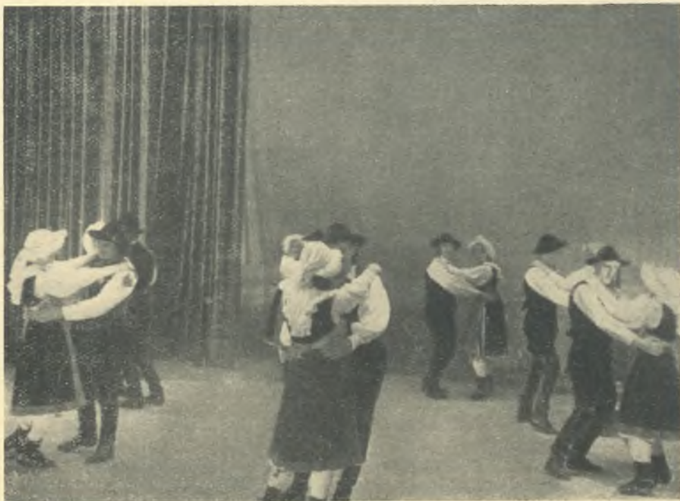
Brnška skupina je na kongresu izvajala Ziljski visoki rej

goriški oblasti organizacijsko utrjevanje ljudske prosvete isto pot kot v predelih stare Jugoslavije, kjer so bila društva z malo častnih izjem orodje reakcionarnih elementov, katerim naj bi pomagala na nek način uveljaviti njihovo protiljudsko delo. Res je, da se je tu ali tam v obnovljenih društvih tudi v goriški oblasti skušal uveljaviti kak protiljudski rogovilež, vendar ni pretirano domnevati, da bi kulturno prosvetno življenje v goriški oblasti danes dajalo že boljše rezultate, če bi bilo v delu več načelne borbe, pa manj administrativnega poseganja v razvojni proces kulturno-prosvetne rasti na tem koščku naše zemlje.