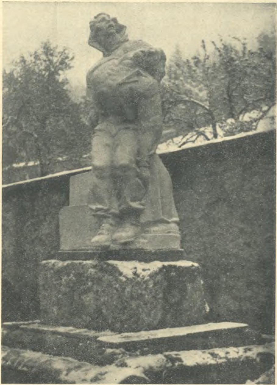
SPOMENIK OBGLAVLJENIM ŽRTVAM V SELAH