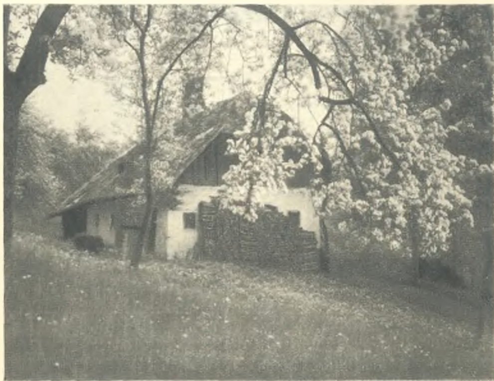
POMLAD NA GORSKEM DOMU

Moj oče je bil odločen, resen in varčen mož. Opojnih pijač ni užival in gostilne so mu bile nepotrebne. Za potovanje so zadostovali košček prekuhanega mesa, kruh in sveža voda, v katero je dal košček sladkorja.