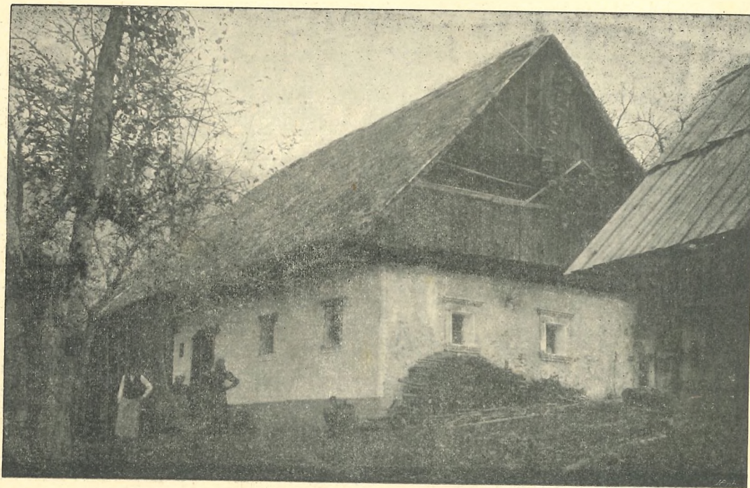
Pod. 3. PRADOM BLEIWEISOVIH V TRSTENIKU.