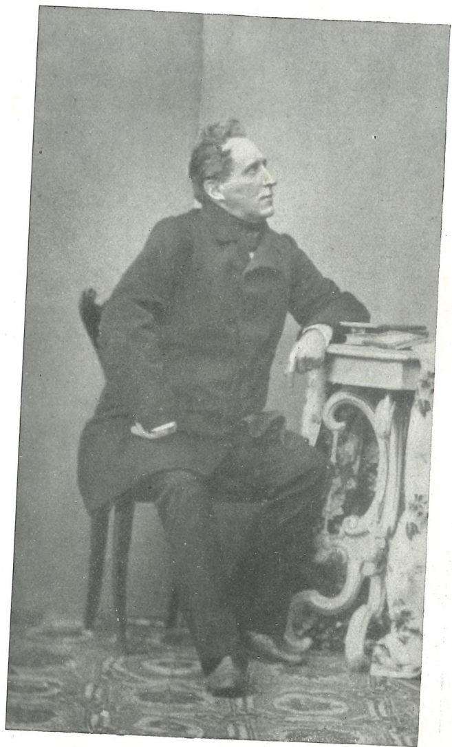
Dr. JANEZ BLEIWEIS.