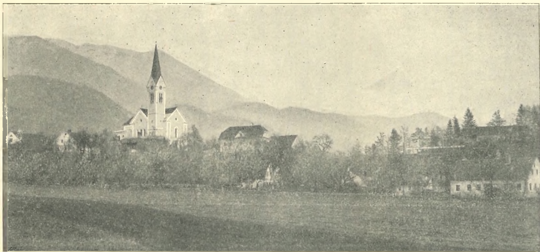
Pod. 2. TRSTENIK.