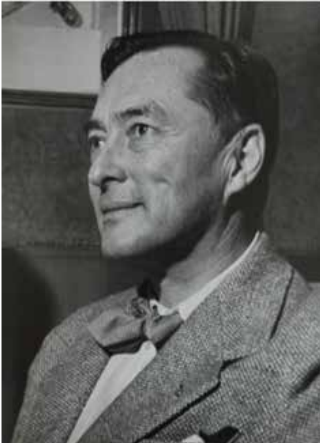
Slika 1: Richard Nikolaus grof Coudenhove-Kalergi.

Dr. Richard Nicolas grof Coudenhove-Kalergi je bil avstrijski politik, diplomat in filozof ter potomec vplivnih plemiških družin iz Nizozemske