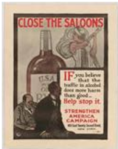
Slika opozarja na škodljivost alkohola. 6

mnenja je bil tudi bralec časnika Glas naroda . 4 V rubriki Dopis je zapisal: "Kar se pa prohibicije tiče, je moje mnenje, da so pijanci največ pripomogli do prohibicije. Če bi se tukaj tako pilo kot v starem kraju, ne bi imeli prohibicije. Ali tukaj se je pilo preveč. Alkohol je sovražnik človeštva." 5