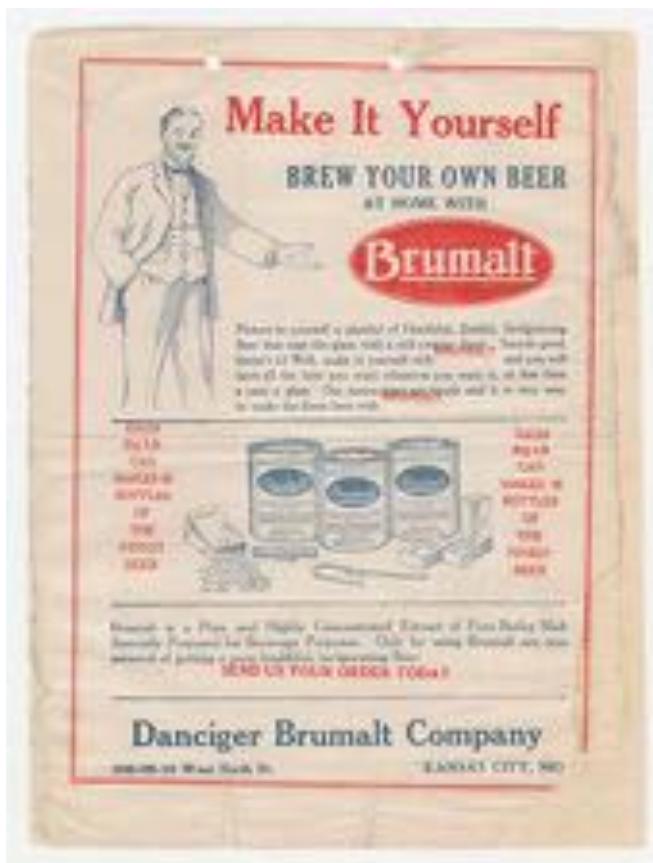
Slika 3: Recept za domače pivo. 55

a za dvajset tisoč družin, ki ne morejo dobiti stanovanja so dobre stare podrtje železniške barake. Taka je prohibicija z vsemi svojimi blagoslovi. 54