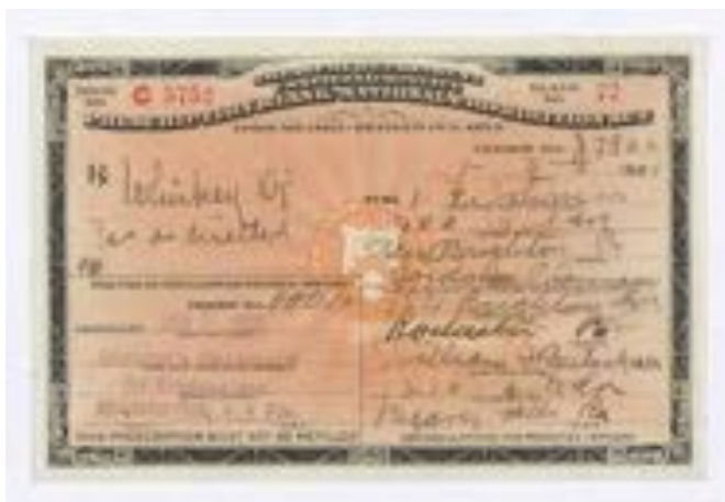
Slika 2: Zdravniški recept za viski. 25

kršenja prohibicijskega zakona so lahko prejeli denarno ali pa zaporno kazen, niso pa bili redki tudi primeri, v katerih so prekrškarji dobili obe. Za lažje razumevanje novih predpisov so se ljudje lahko podučili tudi o definiciji prepovedanih pijač; mednje so namreč uvrščali "alkohol, žganje, brandy, gin, whisky, rum, pivo, neohmeljeno pivo (ale), porter, vino, jabolčnik, spirituozni slad ali vinske pijače, ki vsebujejo več kot pol procenta alkohola". 23 Kot sem omenil že v uvodu tega prispevka, je še vedno obstajalo nekaj izjem pri prodaji in uporabi žganja – med slednjimi je bilo najbolj poznano lekarništvo. Če so lekarnarji želeli prodajati opojno pijačo, so za to potrebovali posebno licenco. Tudi zanje pa so veljale določene omejitve. Po določilih naj bi lekarnar bolniku predpisal največ en pint žganja za desetdnevno obdobje. Dejanje je moral opraviti pod prisego, vse potrebne podatke pa je zapisal na predpis. 24