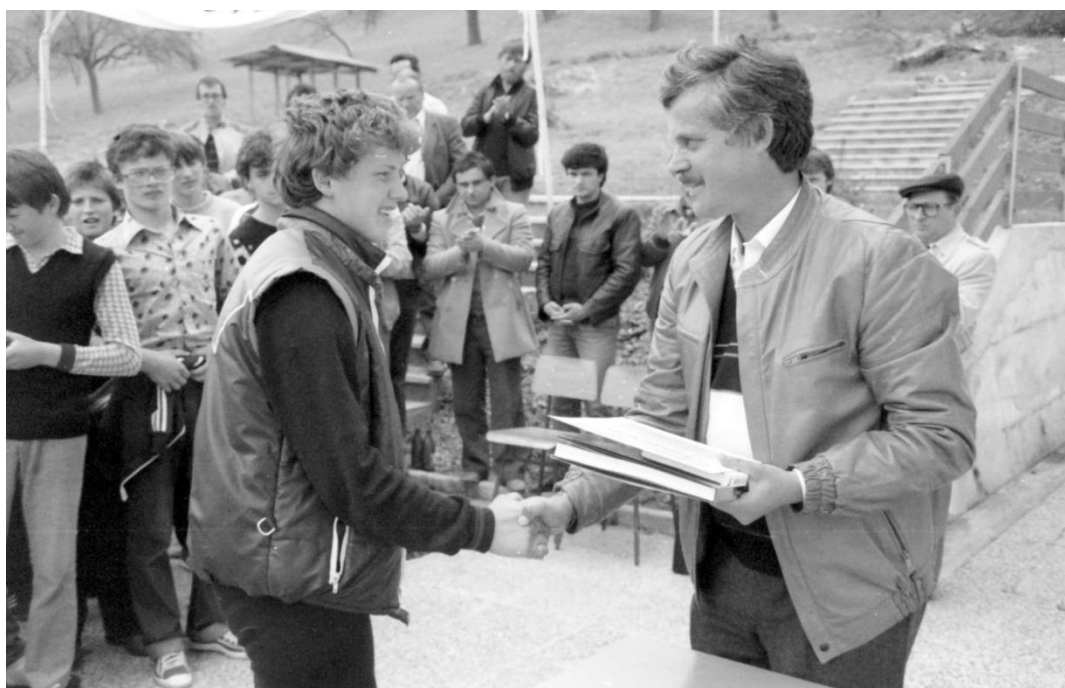
Slika 4: Podeljevanje nagrad učencem obrambnega krožka v Konjicah.