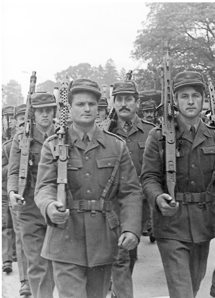
Slika 3: Teritorialci Zreške čete leta 1972.