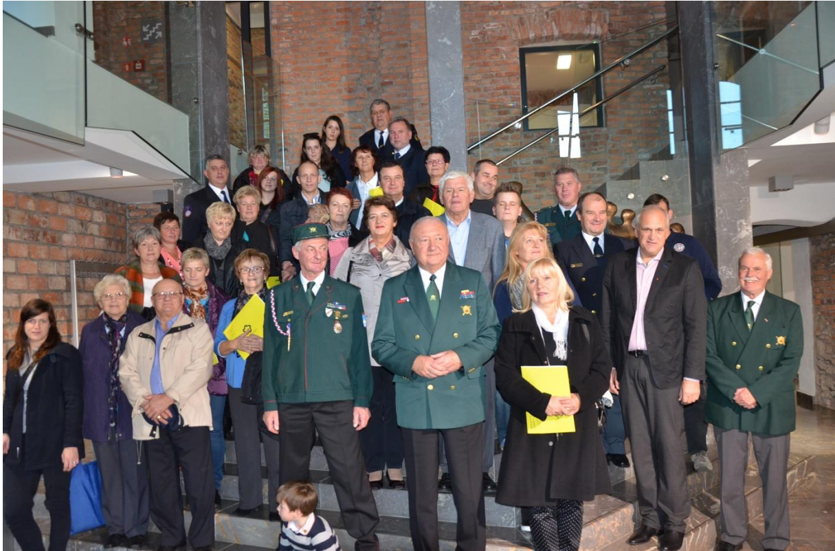
Slika 7: Tradicionalno srečanje svojcev padlih žrtev vojne za Slovenijo, študentov Študentske organizacije Univerze Maribor in organizatorjev v Velenju leta 2016.