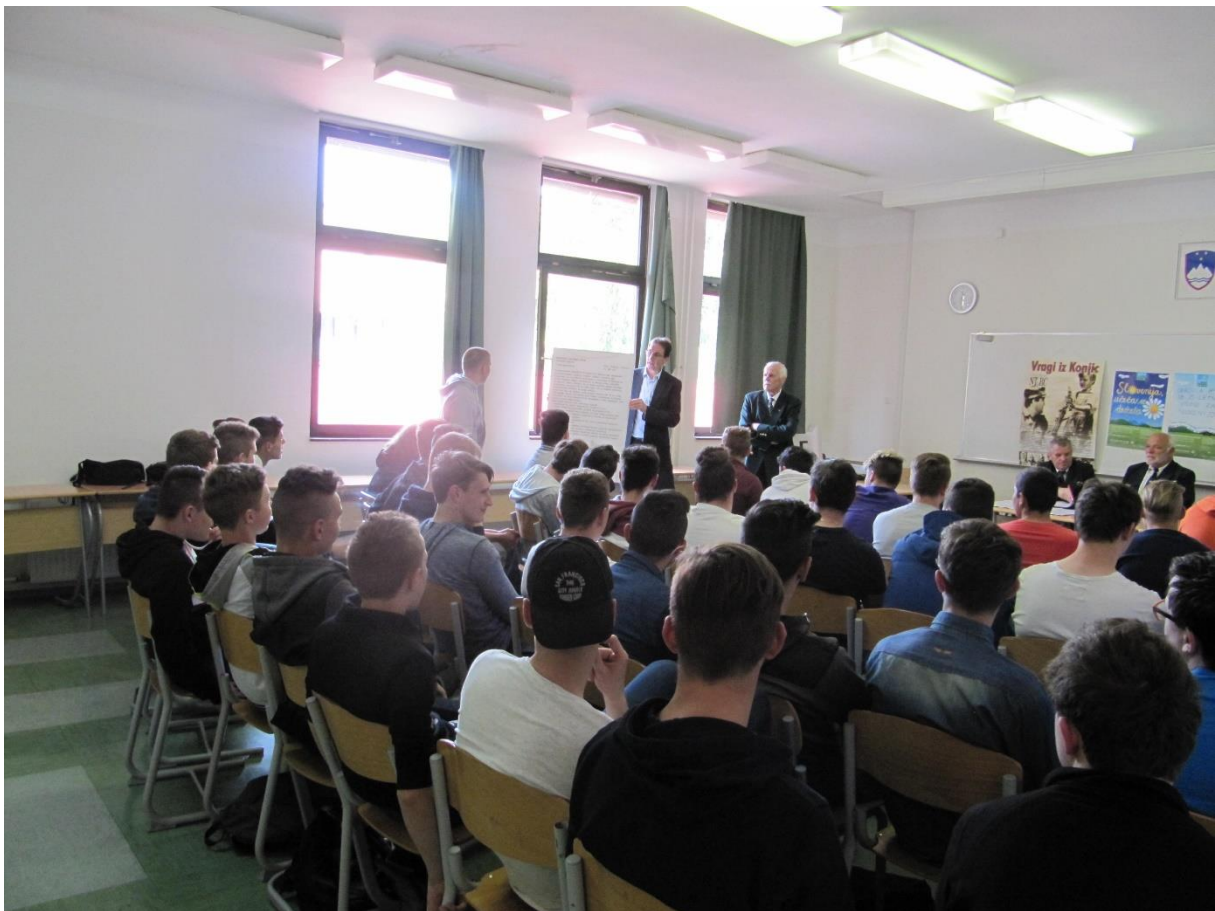
Slika 6: Pogovor o vojni za Slovenijo leta 1991 z dijaki Srednjega šolskega centra v Zrečah.