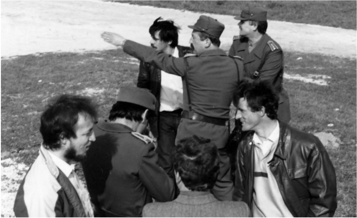
Slika 5: Priprave na vojaško vajo Dravinja 88.