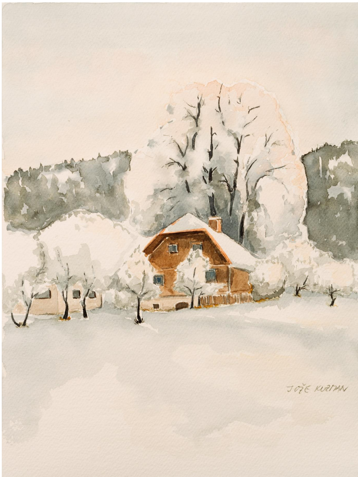
Slika 8: Jože Kuzman, akvarel. Motiv iz Hudinje nad Vitanjem.