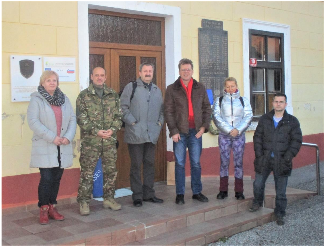
Slika 8: Kolektiv Vojaškega muzeja Slovenske vojske na ogledu stalnih muzejskih zbirk na terenu, Sromlje 2017.