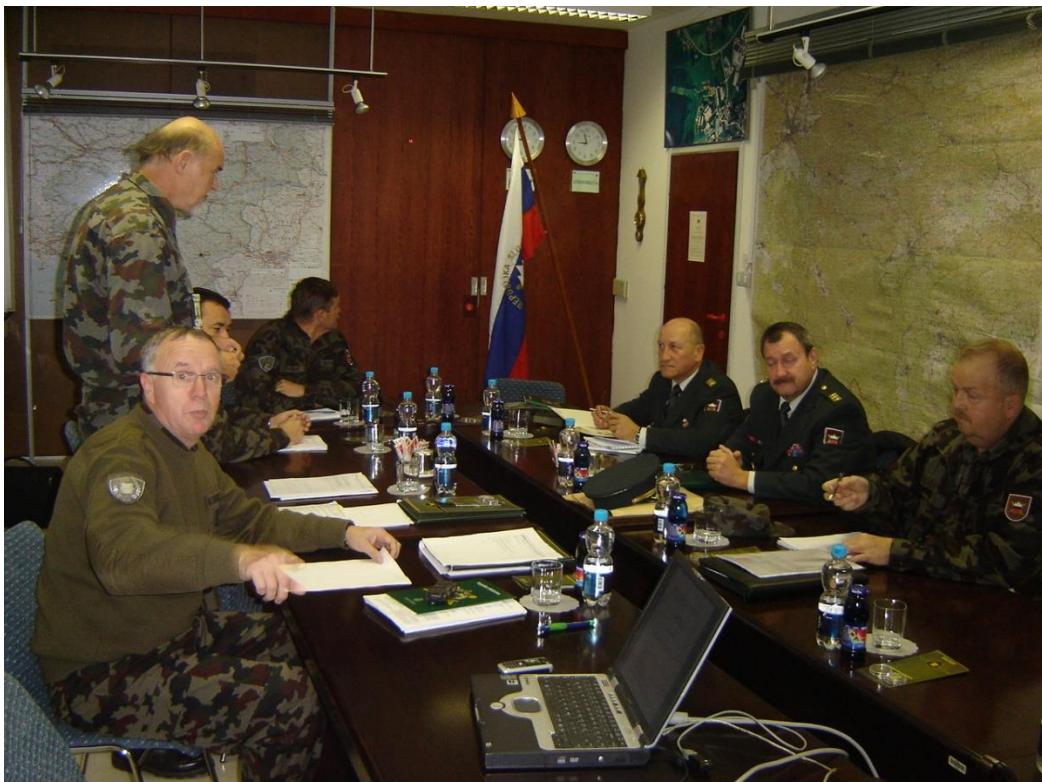
Slika 5: Na obisku pri 32. Vojaško teritorialnem poveljstvu v Novem mestu leta 2007.