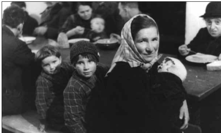
Mati z dojenčkom in otrokoma pri mizi v Cukrarni

dan miloščino in z njo dajati tudi potuho delomržnim postopacem ali pa bodo rajši podpirali to mestno ustanovo, da se popolnoma odpravi beračenje, ki stane več kot vzdrževanje tega novega zavoda v cukrarni.« 891