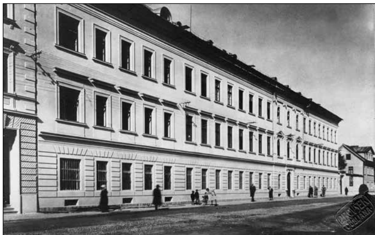
Hiralnica sv. Jožefa