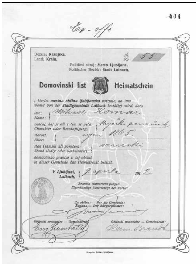
Domovinski list (SI_ZAL_LJU489_f1659_fol404)

težko pričakovali v kmečkih občinah, iz katerih so ljudje odhajali v mesta in industrijska središča, še zlasti v manjših občinah, ki niso imele na voljo dovolj sredstev za vzdrževanje ubogih. 775