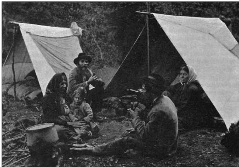
Romski tabor, foto K. Čeč (Dom in svet, št. 9, 1903, str. 552)

sezonsko (s sejma na sejem, z žetve na žetev, na sezonsko delo), od pomladi do zime. Prezimovali so v hišah oziroma kočah, nekateri tudi v šotorih. 585 Čeprav je obstajalo prepričanje, da je potovanje del romske narave in »wanderlusta«, so le-ti potovali tudi zato, ker jim je nomadski način življenja omogočal stalni dohodek, v okolju, kjer so bili praviloma nezaželeni. 586 Vendar so naseljevanje Romov oteževale tako oblasti, ki jih niso želele na svojem ozemlju (občine so v svojih poročilih navajale, da v njihovo občino ni pristojnih ciganov, 587 ali pa so trdile, da jih je preveč, in predlagale, naj jih porazdelijo še po drugih občinah 588 ), kot samo prebivalstvo. Pri tem je šlo večinoma za predsodke in