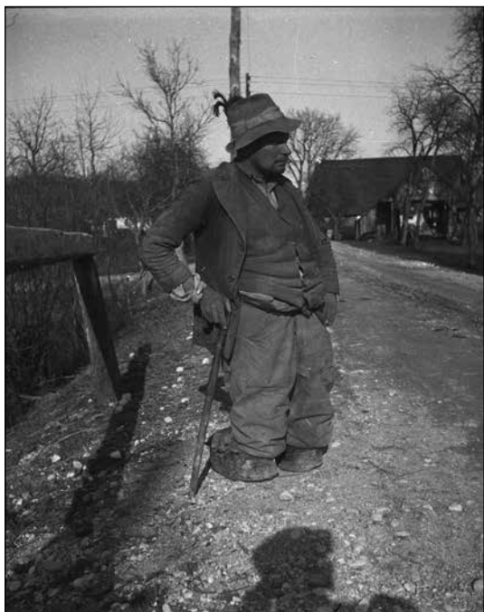
Berač ob poti leta 1932

(Slovenski etnografski muzej, foto Peter Naglič, F_1932_3_6_019)