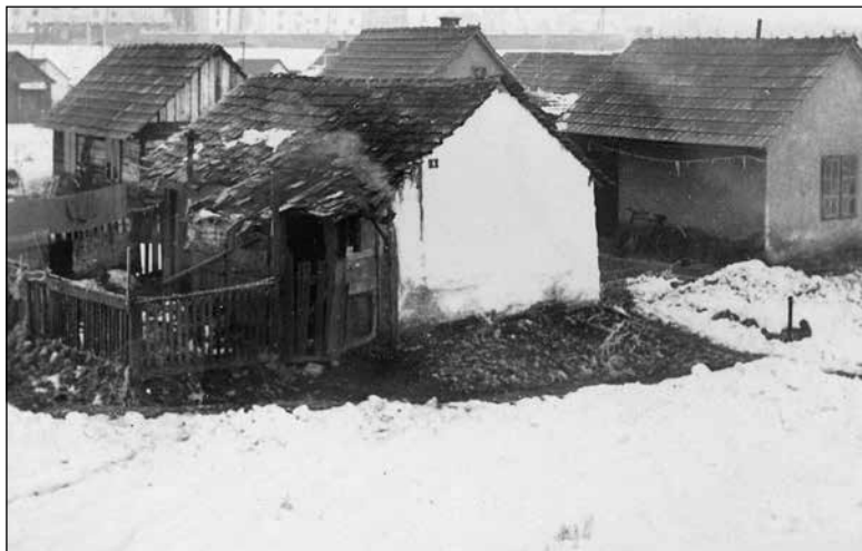
Skupine stanovanjskih hišic v gramozni jami za Bežigradom

družine, smrti hranilca), in bi hkrati utrdilo osnovna načela dela in zanašanja nase. Na drugi strani naj bi zavarovanje olajšalo mestne blagajne pri plačilih podpor. 11 V najslabšem položaju je bila populacija, ki je bila popolnoma izvzeta iz zavarovanja. Zlasti je bilo prizadeto kmečko prebivalstvo, ki se je v skrajni sili lahko obrnilo le na javno pomoč.