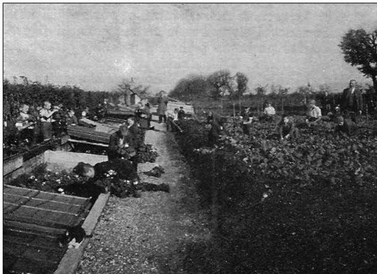
Delo gojencev na vrtu ponoviške graščine (Kronika slovenskih mest, št. 2, 1936, str. 120)

med seboj okoličani, zvečer so preje in trdneje zaklepali dveri ...« 193 Zavod je na tej lokaciji deloval do leta 1936, ko so ga premestili v bivšo žrebčarno na Selu pri Ljubljani. 194