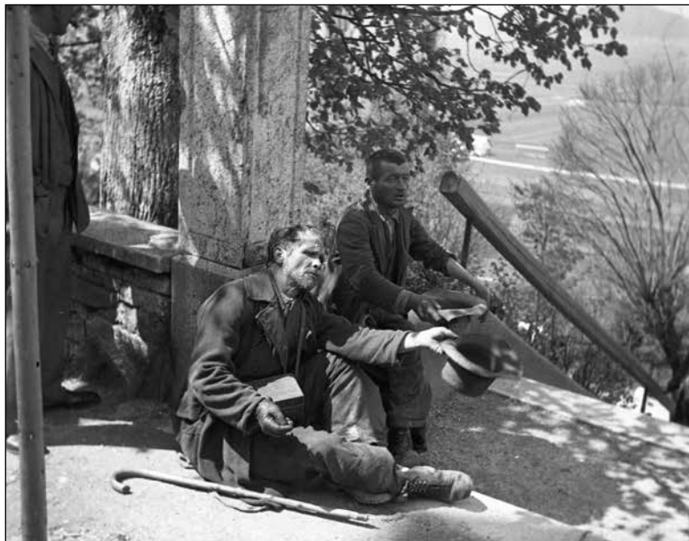
Berača pred cerkvijo na Homcu ob birmi leta 1937 (Slovenski etnografski muzej, foto Peter Naglič, F_1937_1_12_004)

Berači so beračili v svojem lokalnem okolju ali pa so se odpravili tudi v kakšen bližnji, včasih pa tudi daljni kraj, ker so si v večjem mestu obetali več možnosti za pridobitev miloščine ali pa so se udeležili sejma, cerkvenega praznika in drugih prireditev, kjer je množica ljudi ob boljšem zaslužku omogočala tudi priložnosti za drobne tatvine. 219 Beračili so na ulici, od hiše do hiše, 220 po stanovanjih, gostilnah 221 in kavarnah (tudi s pomočjo igranja na glasbila, na primer na harmoniko, citre 222 ), 223 trgovinah. 224 Posamezni berači so pogosto beračili na stalnih