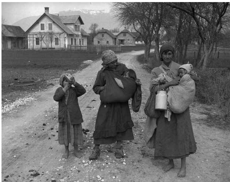
Rominji z otroki na cesti v Šmarci leta 1933

(Slovenski etnografski muzej, foto Peter Naglič, F_1933_1_6_014)