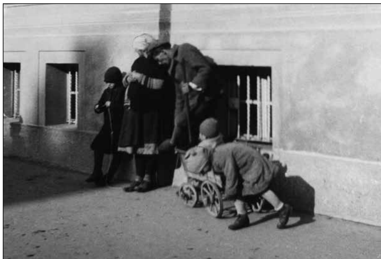
Revna družina berači

pripeljali v situacijo, v kateri je bil prisiljen beračiti, zelo različni in so se včasih navezovali na določeno življenjsko obdobje, včasih pa ne. Tako je posameznika v beračenje prisililo pomanjkanje, do katerega je prišlo zaradi starosti, bolezni, duševne motnje, poškodbe, invalidnosti, smrti hranilca družine na eni strani ter izgube dela ali imetja, slabe letine, naravne nesreče na drugi strani. Ženske pa so bile ranljive zlasti zaradi svojega odvisnega položaja skozi vse življenje, saj so bile kot vzdrževani družinski člani sprva odvisne od očeta, kasneje pa od moža, ki jih je preživljal, tiste, ki so bile zaposlene, pa so bile zaradi nizkih mezd in številnih otrok ves čas na robu obubožanja.