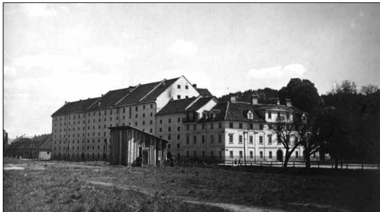
Cukrarna na Poljanskem nasipu

so hrano lahko dobili tudi tisti brez nakaznice, če je tisti dan niso mogli pridobiti. Tako moški kot ženske so morali za tridnevno prehrano delati en dan, za celotedensko pa dva dneva. Kdor se je delu izmikal, je avtomatično izgubil pravico tako do prehrane kot do prenočišča. Enako pa se je zgodilo tudi v primeru nespoštovanja hišnega reda: »Prav tako izgubi to pravico tudi oni, ki zabavlja čez mestno kuhinjo in prenočišče, trosi neresnične vesti, ščuva druge, dela nered, prihaja vinjen v zavod in se sploh s takimi dejanji izkaže nevrednega podpore.« Brez dovoljenja in posebnih omejitev je bilo dovoljeno le zadrževanje v ogrevalnici, kamor so se lahko zatekli vsi tisti, ki niso imeli dnevnega bivališča. Izjema so bile vinjene osebe in ženske. Prenočevalnica je bila odprta od 20. do 8. ure, vsi, ki so želeli v njej prenočiti, pa so se morali zglasiti do 21. ure. Obdobje bivanja v prenočevalnici je bilo omejeno na en mesec, le izjemoma pa je bilo odobreno še za dodaten mesec. Kdor ni imel nakaznice, je lahko izjemoma enkrat prenočil, pred nedeljami in prazniki pa do prvega delovnika. Prav tako so lahko le izjemoma prenočili zaposleni, dokler niso prejeli prvega plačila. 873 V mestni preno-