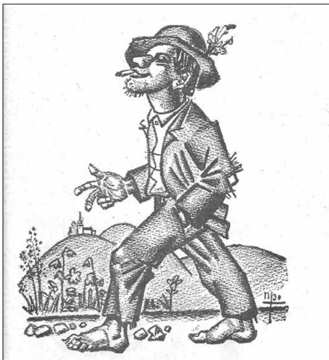
Niko Pirnat, Potepuh na pomladni poti (Življenje in svet, št. 23, 6.6.1930, naslovnica)