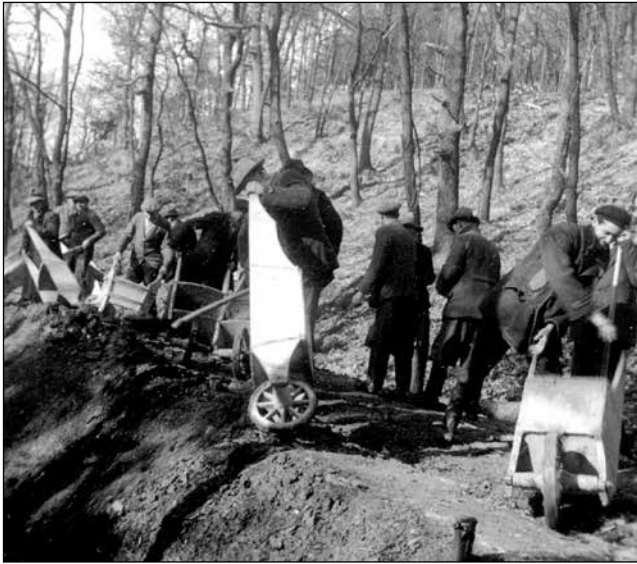
Brezposelni pri cestnih delih na Šišenskem vrhu (ZAL, Zbirka fotografij, A02-158)

evidenco in jih izključili iz podpornega sistema. S takšno ureditvijo so bili na mestni občini zadovoljni in so jo nameravali nadaljevati tudi v prihodnjih sezonah: »Tudi letos bo moral vsak težaškega dela zmožni brezposelni delati vsaj 1 teden pri raznih zasilnih delih na Rožniku, v vrtnariji in na Gradu.«