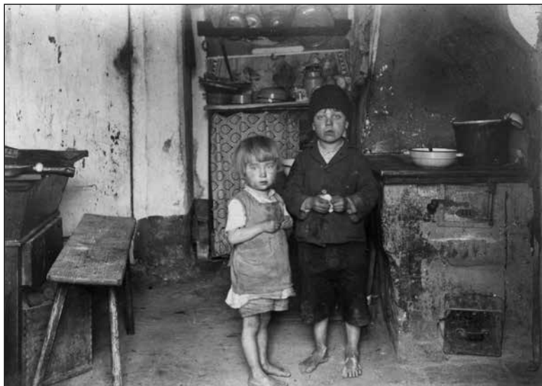
Notranjost bivališča revne družine z dvema otrokoma, Trbovlje (MNZS, Fototeka,SL9743)

ki pa je zajemala le delavsko zaščitno zakonodajo. 28. decembra 1887 je bil sprejet Zakon o nezgodnem zavarovanju in 30. marca 1888 Zakon o bolniškem zavarovanju . Kljub temu da je omenjena zakonodaja predstavljala napredek na socialnem področju in je pomembno vplivala na položaj delavstva, pa je imela številne pomembne omejitve in pomanjkljivosti, ki so se kazale v dejstvu, da ni obravnavala vseh delavcev enako, ni zajemala velikega dela populacije, zato je mnogo ljudi živelo brez kakršne koli socialne zaščite.