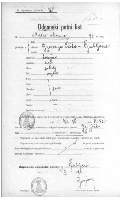
Odgonski potni list (SI_ZAL_LU15_te40_ae427)

cenene, odvisne delovne sile, saj si osebe, ki v določeni občini niso imele domovinske pravice, pogosto niso upale zaprositi za pomoč, ker so se bale pregona in so se bile prisiljene znajti po najboljših močeh, kar je pomenilo, da so bile prisiljene delati in živeti v slabih pogojih. 104