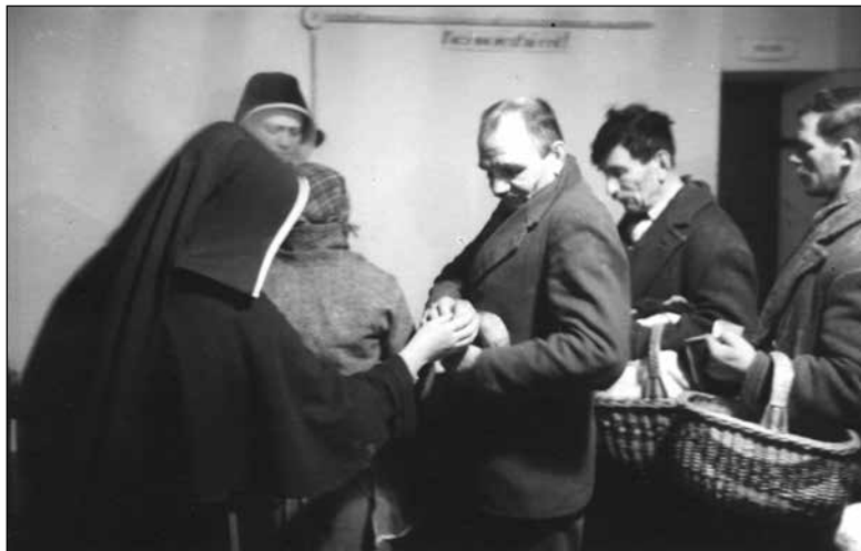
Delitev hrane v Cukrarni

4. maja 1939 so v mestnem zavetišču odprli nov oddelek, Prehodni otroški dom »za male berače«, 883 ki je bil namenjen oskrbi zanemarjene mladine. 884 »Otroci, ki so prej nadlegovali prebivalstvo z beračenjem in prodajanjem podnevi in ponoči ter zanemarjeni tavalj po cesti v pogubo,« 885 so bili tako preskrbljeni, dokler ni bilo ugotovljeno, kdo so njihovi starši oziroma dokler se ni kako drugače ukrepalo. Prostori so bili urejeni v prvem nadstropju in so obsegali dnevno sobo, kapelico, spalnici za dečke in za deklice, manjšo dnevno sobo za dečke, sobo za nadzor in dve sobi za vzgojiteljice. 886 Bolni otroci so bili ločeni od drugih. 887