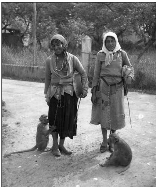
Rominji z opicama leta 1934

Reševanje romskega vprašanja je bilo osredotočeno na zaposlovanje in naseljevanje Romov ter vzgojo njihovih otrok. Romi so bili redko zaposleni, zato so bili izolirani in revni. Logična posledica teh okoliščin je bila, da so občasno storili tudi kazniva dejanja. 607 Kljub določenim pozitivnim ukrepom pa se razmere niso bistveno spremenile, tako da je bilo romsko vprašanje ob koncu obravnavanega obdobja enako živo kot pred desetletji, na kar kažejo stalna opozorila o pojavljanju Romov na določenem območju in navodila za ustrezno ukrepanje proti njim.