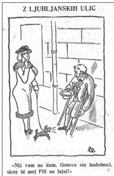
Z ljubljanskih ulic (Toti list, št. 7, 27.5.1939, str. 16)

Kljub temu da so bili ljudje pripravljene nameniti pomoč beraču, ki jo je očitno potreboval, pa je bil pogosto tudi v teh primerih prisoten dvom o resničnosti stiske berača. Spet drugi so bili mnenja, da so si berači sami krivi za svojo nesrečo zaradi moralnih napak ali nesposobnosti, da bi se vključili v družbo. 271