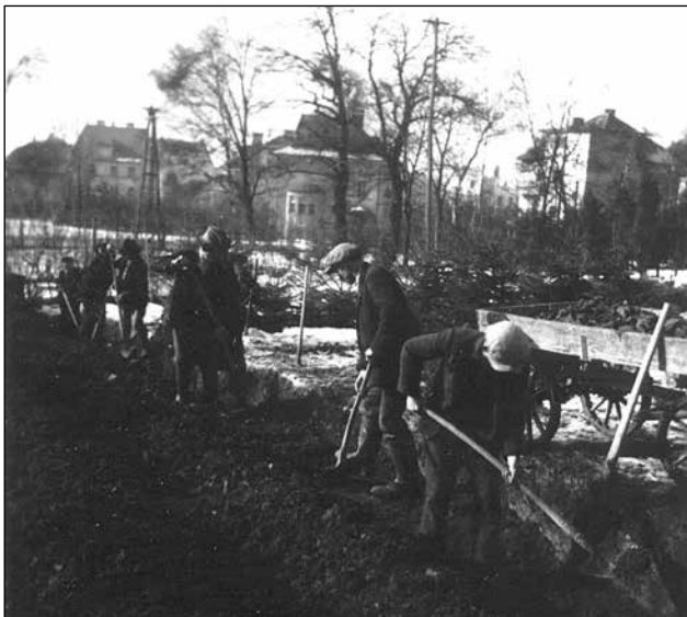
Brezposelni pri cestnih delih v mestni vrtnariji

iz česar je razvidno, da so se podpore v denarju podeljevale le izjemoma: »/.../ Večkrat se izkaže, da denarna podpora ne zaleže veliko, ker se neekonomično porabi. Ako je podpora namenjena za to, da se prosilca obvaruje stradanja, potem je pametneje, da se podporo nakaže v naturi, ne pa v gotovini.« 855 Pri tem je pravilnik o razdelitvi sredstev Zimske pomoči v točki 32. določal, da so bili do pomoči v naravi upravičeni predvsem tisti prosilci za pomoč, ki so bili bolni, pohabljeni in za delo nezmožni, »ki si sami ne morejo preskrbeti zadostnih sredstev za hrano, obleko, obutev in stanovanje«, 856 iz česar je izhajalo, da so si morali vsi ostali podporo po možnosti prislužiti. Tako so na primer v zimski sezoni 1931/32 pri mestni občini zaposlili med dvajset in trideset oseb, sposobnih težaškega dela v mestni vrtnariji, ki so za en teden dela štiri tedne prejeli podporo. O vseh tistih, ki dela niso sprejeli ali pa so ga brez opravičila zapustili, so vodili