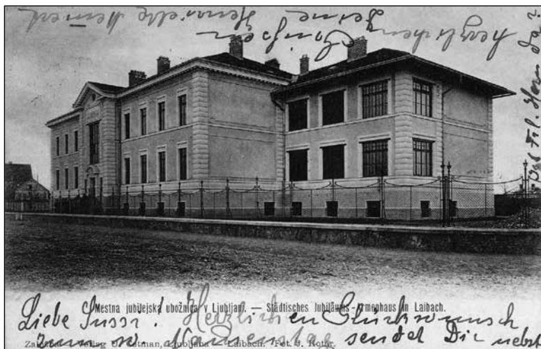
Mestna jubilejna ubožnica

Kako veliko breme so bili reveži za občine, ki so jih morale oskrbovati, in kako zelo so si poskušale to breme olajšati, je razvidno iz zelo skrajnih poizkusov, kot je bilo omejevanje porok med reveži oziroma porok »na roko«. 804 Čeprav je bilo izdajanje ženitnih dovoljenj z namenom omejevanja sklepanja zakonskih zvez revnega prebivalstva dokončno odpravljeno leta 1868, so se posamezne občine še v 80. letih zavzemale za ponovno uvedbo le-teh. 805 V določenih primerih so posamezne dežele to zahtevale vsaj za tiste osebe, ki so bile v občinski ubožni oskrbi, ali tiste, ki so se preživljale na nezakonit način, vendar so bile vse pobude zavrjene kot nasprotujoče modernim pravnim načelom, hkrati pa je bilo poudarjeno, da takšen ukrep nima nobenega učinka. 806 O problemih, ki so izhajali »iz tega, ako se sme vsak berač in vsak lenuh ženiti«, so večkrat burno razpravljali tudi v kranjskem deželnem zboru, vendar brez uspeha. Leta 1885 so