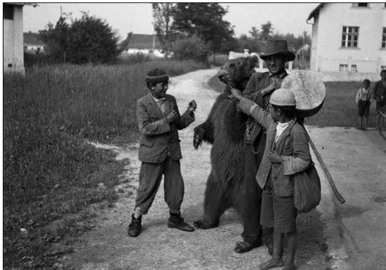
Romi z medvedom

(F_1934_2_3A_004)