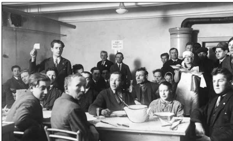
Javna kuhinja v Delavski zbornici

izobražencev jasno kaže na dejstvo, da vsi brezposelni in potrebni pomoči niso bili enaki in enakopravni ter da se je tudi v tej situaciji potegnila jasna ločnica med enimi in drugimi. Določeno razlikovanje je mogoče zaznati tudi med samimi delavci: »V takem azilu bi prenočevali predvsem obrtniški in tovarniški delavci oziroma tudi oni nekvalificirani delavci, katerim glede snage ni prigovarjati.« 890