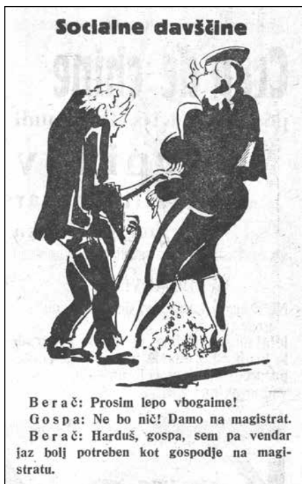
Socialne davščine (Toti list, št. 7, 27.5.1939, str. 13)

oblačili, enako tudi v Ljubljano nepristojni, vendar pa bi v tem primeru morala del stroškov kriti njihova domovinska občina ali pa bi bili odpravljeni iz Ljubljane. V skladu z navodili naj bi se podpore razdeljevale le v naravi, sploh vsem tistim, ki so jih imeli na sumu, da bi z denarjem ravnali neodgovorno, in le izjemoma v denarju ter z nakazili hrane v javni kuhinji. Tudi javnost je bila opozorjena, naj ne daruje denarja ali oblačil beračem, hrano in oblačila pa le izjemoma v primerih, ko berača dobro poznajo. 243