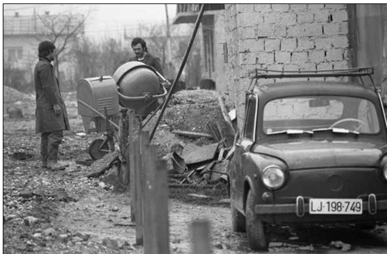
Gradbena dejavnost na Rakovi jelši (marec 1978)