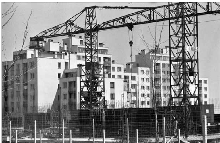
Gradnja stanovanjske soseske za Bežigradom (april 1975)

Opisana stanovanjska politika je privedla do različnih načinov stanovanjske gradnje. Glavni so bili družbena gradnja, zadružno organizirana gradnja in individualna ali zasebna gradnja. Kategorij družbenih stanovanj je bilo več. Največ jih je bilo v lasti delovnih organizacij, manj v lasti republike ali občin. Ob koncu socializma leta 1990 je bilo na primer v lasti delovnih organizacij 68 odstotkov družbenih stanovanj, v lasti občin 30 odstotkov in v lasti države le 2 odstotka. 873 V okviru delovnih organizacij so delovali stanovanjski skladi in stanovanjske komisije, ki so določale, koliko denarja, ki so ga imeli skladi, se bo namenilo za pridobivanje družbenih stanovanj in koliko za stanovanjska posojila, ki so jih zaposleni potrebovali za nakup stanovanja ali gradnjo hiše. 874 Občine so razpolagale s solidarnostnimi stanovanji, ki so bila namenjena delavcem z nizkimi dohodki, upokojujencem, invalidom in borcem. Republika je