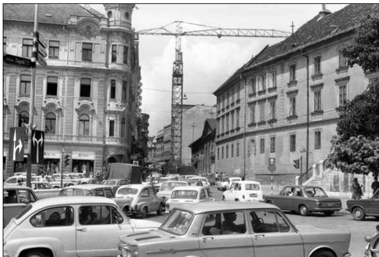
Prometni kaos na preobremenjenem Prešernovem trgu in Čopovi ulici avgusta 1972

z javnim prevozom v Ljubljano začelo voziti z avtomobilom. Kljub temu je naraščalo tudi število potnikov v avtobusnem mestnem prometu. Pri tem se število prog mestnega prometa ni bistveno spremenilo, nekoliko se je povečalo šele proti koncu sedemdesetih let. Ob koncu leta 1971 so iz prometa izločili trolejbus. Do takrat je trolejbus vozil na eni progi, avtobusi pa na dvanajstih. 418 Med letoma 1974 in 1979 se je število avtobusnih prog povečalo s 16 na 19. 419 V občinskih glasilih so zato pogosto pisali, da si občani želijo bolj urejen mestni promet in bolj pogoste povezave. Neustrezne avtobusne povezave so težave v vsakdanjem življenju povzročale predvsem prebivalcem podeželja, saj se jih je veliko dnevno vozilo na delo v Ljubljano. Avtobusi so vozili poredko, kar se je poznalo zlasti v jutranjih in večernih urah, na njih je bila pogosto velika gneča.