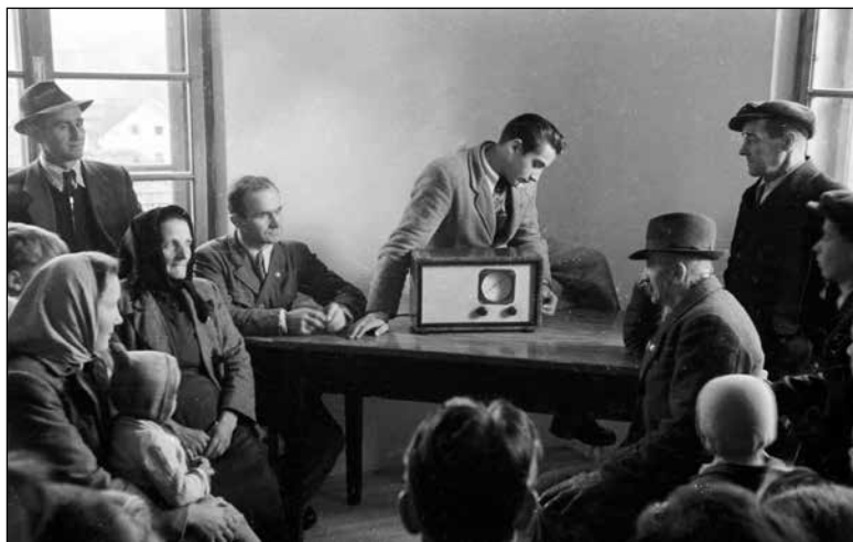
Poslušanje radia v zadružnem domu v Polhovem Gradcu decembra 1948

po več generacij hkrati, drugih stanovanj je bilo malo. 222 Mnogi pričevalci so opisovali, da so življenjski ritem narekovali narava, kmečka opravila in praznovanja. Otroci so morali že v zgodnjih letih prevzeti skrb za določena dela, kot je bila paša živine, skrb za mlajše brate in sestre, pomoč pri kmečkih opravilih ali sobotno pospravljanje in ribanje lesenih tal. Delo je bilo pogosto pomembnejše od šolskih obveznosti, otroci so vstajali zgodaj, da so svoje delo opravili pred začetkom pouka. Z določenimi opravili, kot je nabiranje gozdnih sadežev ali zelišč, so zaslužili tudi nekaj denarja za lastno porabo. Nekateri pričevalci so se spominjali, da jim starši zaradi skromnih razmer niso mogli plačati šolanja. 223