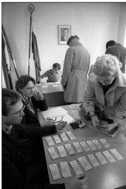
Delitev bencinskih bonov decembra 1982

priznal, da so prebivalci Ljubljane nekatere ukrepe lažje sprejeli, medtem ko so bencinske bone, predvsem pa depozit za prehod državne meje močno kritizirali. 458