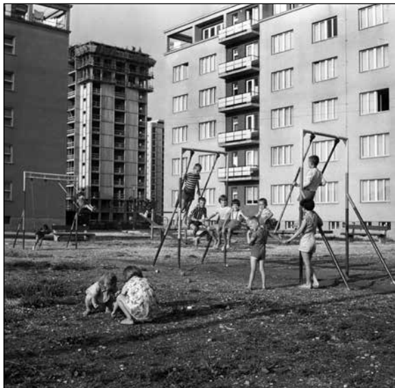
Otroci na igrišču v Savskem naselju julija 1960

petdesetih let povečevale in kazale na razvoj živahne gradbene dejavnosti. 843