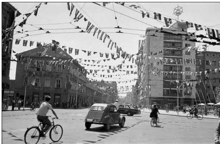
Ljubljana leta 1961, praznično okrašena z zastavicami. Na levi je staro poslopje Metalke, na desni poslopje Glavne zadruške zveze.

narodi ter o življenjskem standardu. 556 Raziskava je nastala znotraj danih sistemskih okvirov, kar je treba upoštevati pri njenih rezultatih, a je kljub temu beležila določeno kritičnost ljudi.