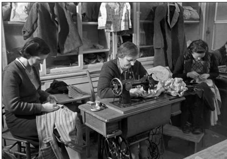
Krpalnica rajona Vič - Rudnik decembra 1948