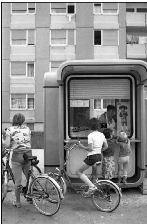
Otroci pri legendarnem rdečem kiosku, delu oblikovalca Saše Mächtiga, junija 1979 v Štepanjskem naselju

življenja. Od 22 samoprispevkov, ki jih je občina razpisala v tem desetletju, jih je bilo sedem namenjenih za ceste in mostove, sedem za vodovod in kanalizacijo, dva za šole, dva za zdravstvene in tele-snokulturne objekte, dva za električno omrežje in transformatorje ter dva za druge vrste komunalne ureditve. Le eden od vseh 22 je bil za več krajevnih skupnosti, 12 jih je bilo za posamezno krajevno skupnost, devet pa za del krajevne skupnosti. 445 Tudi za izgradnjo te infrastrukture so morali dodatno najemati še posojila. 446