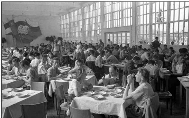
Menza v Litostrouju (julij 1947)

odločilno vlogo v načrtovanju in upravljanju gospodarske politike. 670 A državi ni uspelo rešiti vseh težav delavcev, ki so gradili novo državo, ali uskladiti njihove delovne uspešnosti z njihovim materialnim položajem. Zato je ta področja kompenzirala s simbolnim priznanjem delavskega razreda, z rituali, ki so slavili delo, in z visoko stopnjo socialne varnosti. 671