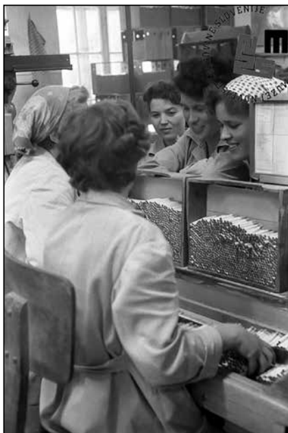
Delavke v Tobačni tovarni novembra 1965

tudi zaradi drugih razlogov. Konflikti so nastajali med delavci in vodstvenim kadrom ter med samimi delavci.