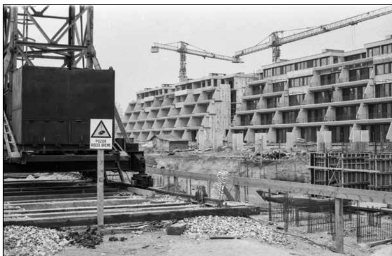
Gradnja terasastih blokov v Kosezah v drugi polovici sedemdesetih let

bilo v ljubljanskih občinah 21.146 telefonskih naročnikov. Največ jih je bilo v Občini Ljubljana Center, kjer je na 1.000 prebivalcev prišlo 390 naročnikov. Povprečje za ljubljanske občine je bilo 92 naročnikov na 1.000 prebivalcev, za Slovenijo pa 34 naročnikov na 1.000 prebivalcev. 423 Čeprav se je do konca desetletja število telefonskih naročnikov znatno povečalo, je bilo leta 1978 v petih ljubljanskih občinah le 53.954 naročnikov, kar je znašalo okoli 18 odstotkov prebivalcev. 424