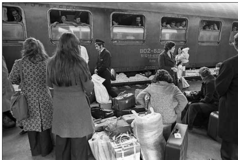
»Gastarbajterji« na ljubljanski železniški postaji februarja 1974

Čeprav je politični sistem gradil na enakosti, se je družba dejansko začela razslojevati. Če je v prvem povojnem obdobju veljalo, da se je novi razred privilegiranih oblikoval iz ozkega sloja politikov in funkcionarjev, se je v sedemdesetih letih oblikoval nov srednji sloj, sestavljen iz srednjih in višjih uradnikov, pomembnejših političnih aktivistov in gospodarstvenikov ter novih zasebnih obrtnikov, ki so se posvečali predvsem dvigu materialnega stanja, politični sistem pa so pogosto sprejemali iz pragmatičnih razlogov. 693 Mnogi prebivalci so si izboljšali gmo-tni položaj z delom v tujini ali delom na črno.