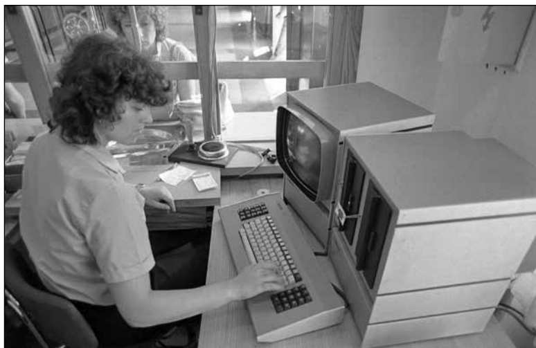
Računalnik si je utrl svojo pot tudi pri prodaji kart na ljubljanski železniški postaji (avgust 1984).

na delovna mesta in od sredine desetletja tudi v izobraževalne ustanove. Slednje so se do konca desetletja že bolje opremile z njimi, čeprav so bile pri tem pogosto odvisne od finančne pomoči delovnih organizacij. V občinskih glasilih so se pojavljali prvi oglasi za računalniške tečaje za otroke in odrasle. Med mladimi so računalniki postajali statusni simbol, a sredi desetletja so jih imeli doma le redki, saj so bile njihove cene visoke. 538