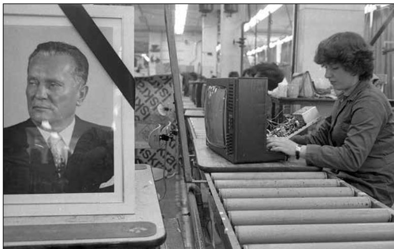
V tovarni Iskra Pržan ob Titovi smrti maja 1980

Nekateri pričevalci so videli vpliv politike na področje zaposlovanja pri včlanjevanju v partijo, ki naj bi po njihovem mnenju prinašalo določene ugodnosti. 702 Pri tem so omenjali možnosti za napredovanje ali pridobivanje službenih stanovanj in ugodnih posojil, vendar so neradi govorili o tem, če so bili ugodnosti deležni sami. Bolj kot to so poudarjali ugodnosti drugih oseb, na primer sodelavcev, in jih pripisovali članstvu v partiji. Vpliv politike na področje zaposlovanja so večkrat omenjali tisti pričevalci, ki so imeli težave pri zaposlovanju ali napredovanju, deloma so s tem opravičevali svoj položaj v delovni organizaciji ali neuspeh pri napredovanju. Prav tako so partiji velik vpliv pripisovali tisti, ki se niso strinjali s političnim sistemom ali so občutili krivice na delovnem mestu. Kljub vsemu je iz pripovedi pričevalcev videti, da so lahko normalno delali in napredovali tudi brez članstva v partiji. Nekateri so sicer čutili, da zaradi