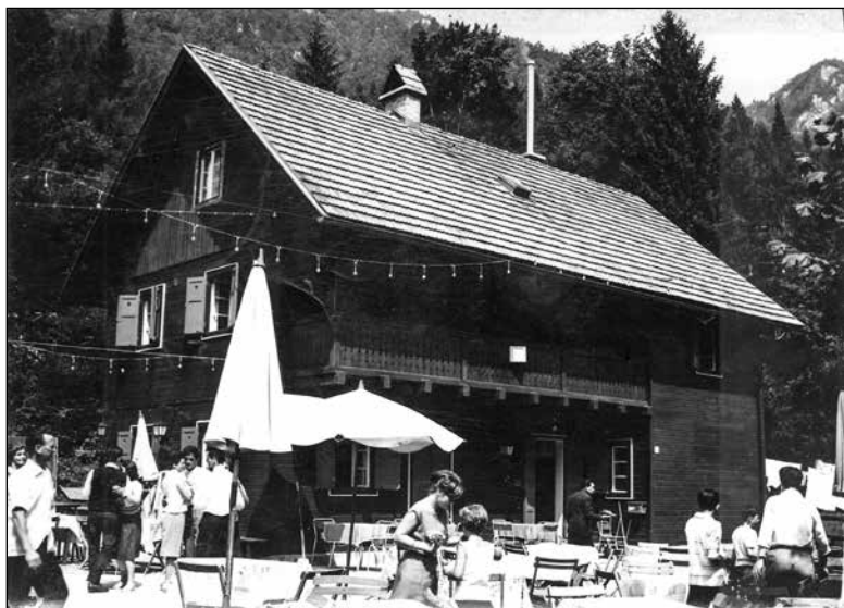
Preživljanje prostega časa ob domu v lškem vintgarju. Razglednica je bila odposlana leta 1964.

Občinska glasila so svoj prostor prav tako posvečala možnostim za letni dopust. Čedalje bolj so poudarjala, da ima po napornem delu in učenju vsak otrok in delovni človek pravico do oddiha, ter oglaševali počitniške skupnosti. Slednje so nudile tudi dopust na kredit. V ospredje so postavljala nujnost načrtna skrbi podjetij za rekreacijo in oddih svojih delavcev. Več prostega časa je seveda omogočilo skrajšanje delovnika na 42 ur, ki so ga poskusno uvedli konec leta 1963. V naslednjem letu so že vsa podjetja prešla na tak delovni čas, kar je pomenilo dober mesec dodatnih prostih dni na leto. Počitniške skupnosti in podjetja so nudili ugodna letovanja. Poleg počitniških kapacitet na morju so imela podjetja še kočje v hribih in svoja planinska društva. Ljubljanci so zaradi tega začeli bolj intenzivno preživljati počitnice ob Jadranskem morju. V večji meri se jim je odprla tudi možnost za potovanja v tujino, ne le za namene nakupovanja, temveč tudi za izlete in študentom za opravljanje