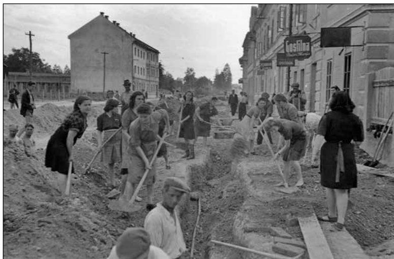
Udarniško delo na Tržaški cesti junija 1947

naslednjem obdobju. 81 Takoj po vojni je bilo zaplenjenih 53 večjih podjetij in več sto zgradb. 82 Večja zaplenjena podjetja so bila Papirnica Vevče, Saturnus, Pivovarna Union, Kemična tovarna Moste, Tekstilna tovarna Josip Kunc et Comp., Stora, Eiffler, Jugoslovska tiskarna, Narodna tiskarna in Blasnikova tiskarna. 83 Po zakonu o agrarni reformi iz leta 1945 je prišlo v državno last 491 hektarjev zemlje, dodatno so zaplenili še 337 hektarjev zemlje. 84 Decembra 1946 so nacionalizirali nadaljnjih 109 večjih podjetij, aprila 1948 pa še 136 podjetij lokalnega pomena. 85 Nekatera podržavljena podjetja so nadaljevala svoje delo. Na osnovi podržavljenega premoženja, združevanja več obratov in prenosa premičnega premoženja iz obrata v obrat so nastajala tudi nova podjetja. Prvi večji projekt industrializacije v Ljubljani