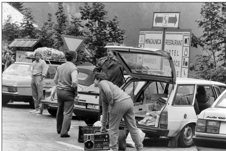
Na mejnem prehodu Ljubelj leta 1986

so v tujini nakupovali enkrat na leto ali manj, drugi vsak drugi mesec. Ljudje so bili navdušeni nad večjo in boljšo ponudbo ter izdelki, ki jih niso videli v domačih trgovinah, nad njihovim lepim videzom ali boljšo kakovostjo. Hkrati so opazali, da so bili izdelki v tujini pogosto cenejši. Kakovost izdelkov pa ni bila vedno nujno boljša. V Trstu so mnogi kupci obiskovali trg Ponterosso, kjer so prodajali predvsem poceni blago. 799 Pričevalci so se poleg tega v tujini naučili kupovati blagovne znamke, ki so doma veljale za boljše, na primer gospodinjske aparate Candy, določene prehranske izdelke ali pralne praške. 800 Nekateri pričevalci so pri tem poudarjali, da se je po izdelkih iz tujine ocnjeval standard posameznika.