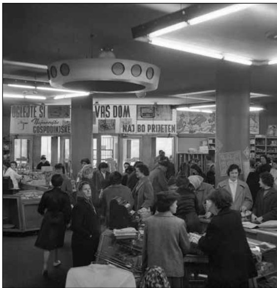
V trgovini Nama maja 1960

identitete, smisla ali zadovoljstva. 749 V Jugoslaviji se je razvila potrošniška kultura, ki je bila netipična za vzhodnoevropske države. Država ni pretirano ovirala razvoja potrošništva in čezmejnih nakupovalnih navad, dejansko jih je odobraval, saj je novi življenjski standard poudarjal blaginjo socialistične družbe kot celote 750 in dokazoval uspešnost njenega modela socializma. Z novoodkrito blaginjo je hkrati krepila zadovoljstvo domačega prebivalstva, ki se je soočalo z omejitvami na trgu. 751