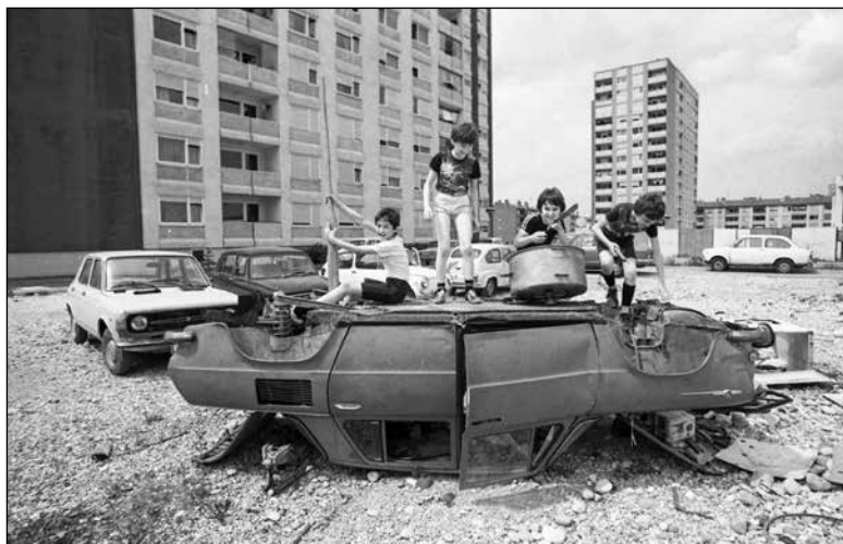
Za igro in druženje pride prav tudi odslužen avto (Štepanjsko naselje, junij 1981).

pomembnejših vrednot. 619 Kljub izrazitemu poudarjanju dobrih odnosov lahko iz pričevanj razberemo, da je v medosebnih odnosih prihajalo tudi do trenj. Negativne izkušnje so izvirale iz razlik v svetovnonazorski usmerjenosti, veroizpovedi, strogosti ali politični aktivnosti nadrejenih. Posamezni pričevalci so prav tako opisovali, da je v službah vladala hierarhija, medtem ko je izpolnjevanje norm spodbujalo tekmovalnost, ki je včasih povzročila tudi napete odnose in ljubosumje. 620 Kljub slabim izkušnjam v službi, ki so jih zlasti z nadrejenimi izkusili nekateri pričevalci, so po drugi strani vedno poudarjali prijateljske odnose s sodelavci, solidarnost in medsebojno pomoč. 621