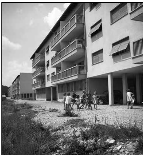
Otroci pri igri pred enim od blokov Litostrojskega naselja leta 1950

je bila večinoma dograjena v začetku šestdesetih let, nekoliko pa se je širila tudi kasneje. Prvo podjetje, ki je začelo graditi za potrebe delavcev, je bilo Litostrojo, ki je med letoma 1947 in 1954 v Šiški sezidal štirinadstropne tipske bloke. Sosesko so kasneje dopolnili z vrstnimi hišami, trgovino, šolo, vrtcem in drugimi javnimi servisi. 164 Po letu 1950 so se Litostroju pri gradnji stanovanj za delavce pridružila še druga podjetja in organizacije.