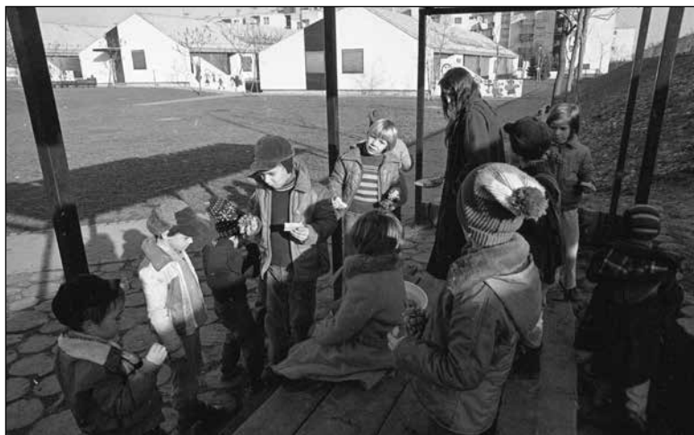
Eden od vrtcev, ki so bili zgrajeni s samoprispevkom (november 1981).

prvim samoprispevkom so v ljubljanskih občinah zgradili 25 vrtcev, v katerih je bilo 3.684 novih mest, 24 osnovnih šol, kar je pomenilo skupno 257 novih učilnic, en dom za starejše občane in en svetovalni center. V obdobju drugega samoprispevka so zgradili 21 vrtcev z 2.776 novimi mesti, 20 osnovnošolskih objektov s 190 novimi učilnicami, pet zdravstvenih objektov in štiri domove za starejše občane. Za izvedbo projektov iz drugega samoprispevka so občani prispevali več kot polovico, to je 63 odstotkov končne vrednosti objektov, za izvedbo prvega pa 43 odstotkov. 916 Ena od pričevalk se je spominjala, da je na ta način dobila službo v vrtcu na Viču: »[...] šestinsedemdesetega leta sem jaz začela v službo hoditi, ko so se na veliko vrtci odpirali, večinoma s tem samoprispevkom in to skoraj, skoraj vse, ki smo končale šolo, smo šle v nove vrtce delat. Takrat se je ogromno gradilo.« 917