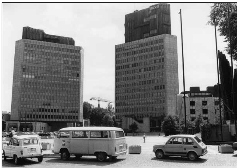
Poslovni stolpnici Ljubljanske banke in Iskre Commerce na tedanjem Trgu revolucije okoli leta 1985