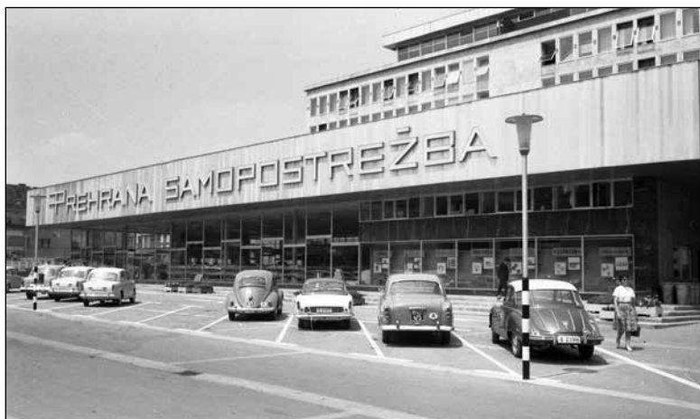
Samopostrežna trgovina na Dalmatinovi ulici, ki so jo odprli leta 1961.

Z rastjo življenjskega standarda so se pojavljale nove potrebe, zato so se tudi občinski organi bolj posvečali potrošnji in izgradnji ustrezne infrastrukture, kot so trgovine, storitveni servisi, objekti prehrane ali objekti za rekreacijo. Želeli so izboljšati preskrbo v novih stanovanjskih soseskah, ki so jih v šestdesetih letih postopoma opremljali s trgovinami. Medtem so se v centru odpirale nove samopostrežne trgovine in prve večje veleblagovnice. Leta 1961 je bila na Dalmatinovi ulici odprta takrat največja samopostrežna trgovina v Ljubljani. 354 Leta 1962 je Nama odprla blagovnico Tromostovje, v naslednjem letu pa se je začela gradnja nove veleblagovnice na današnji Slovenski cesti. Odprta je bila aprila 1965 in je takoj privabila veliko kupcev. V naslednjem letu so odprli še prenovljeno pritličje starega dela Name na Cankarjevi ulici in ga v prvem nadstropju povezali z novim delom. Preskrbo Ljubljančanov so dopolnjevali živilski trgi, kjer se je povečevala ponudba kmetijskih pridelkov zasebnih proizvajalcev. 355 Za pridelavo hrane so Ljubljančani upora-