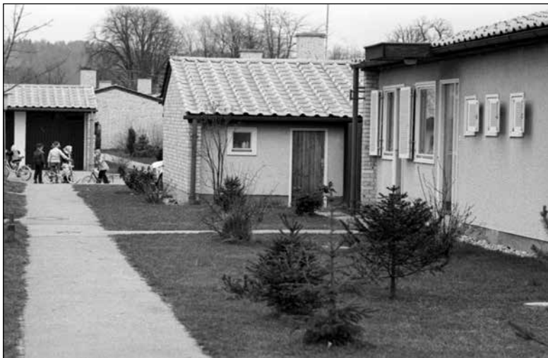
Naselje nizkih stanovanjskih hiš v Murglah (marec 1978)

primanjkovalo. 859 V začetku sedemdesetih let se je odgovornost za stanovanjsko politiko prenesla na republike in občine, v skladu z ustavnimi spremembami so se tudi na stanovanjskem področju pojavile samoupravne interesne skupnosti, ki naj bi združevale sredstva za gradnjo stanovanj, določale politiko in program gradnje ter upravljale družbena stanovanja. 860 Sredi sedemdesetih let so se uveljavila še tako imenovana solidarnostna stanovanja, s katerimi so na občinski ravni skušali zagotoviti stanovanje tistim skupinam prebivalstva, ki ga niso mogle dobiti na podlagi zaposlitve: socialno ogroženim, brezposelnim, invalidom ali mladim družinam. 861 A občinska solidarnostna stanovanja niso bila namenjena le najranljivejšim skupinam, temveč tudi nekdanjim borcem. 862