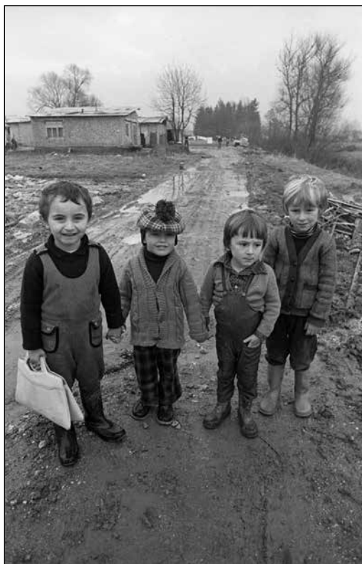
Otroci pred črnimi gradnjami na Rakovi jelši (marec 1978)

velikokrat priseljenci iz drugih jugoslovanskih republik. Oblasti so določena naselja skušale legalizirati, barakarska naselja, kjer so bile življenjske razmere zelo slabe, pa so v sedemdesetih letih večinoma podrle in prebivalce preselile v druga stanovanja. Iz občinskih glasilah lahko vidimo, da so se oblasti zavedale tudi socialne in zdravstvene problematike, ki je izvirala iz neurejenih ali neprimernih stanovanjskih razmer. 907 Črne gradnje na podeželju so večinoma tolerirali in jih kasneje tudi legalizirali.