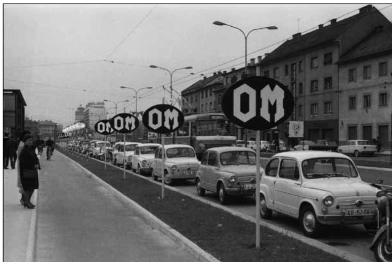
Vrsta fičkov, parkiranih ob Dunajski cesti pri Gospodarskem razstavišču, okoli leta 1970.