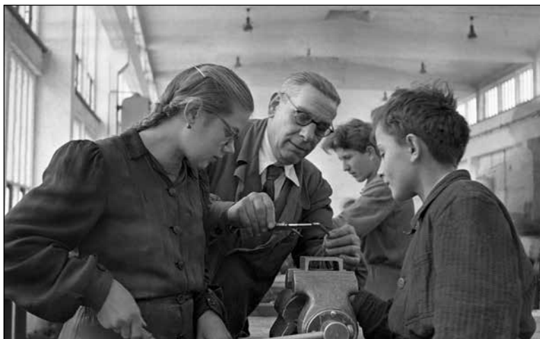
Učenca industrijske šole Litostroj pri praktičnem pouku (januar 1951)

Pozna adolescenca in zgodnja odrasla doba sta pričevalcem prinesli vstop v službeno življenje. Kako hitro so se zaposlili, je bilo pogosto povezano z možnostjo izobraževanja in tudi tu vidimo generacijske razlike. Prva in druga generacija sta imeli slabše možnosti za izobraževanje, kar se je odražalo v povprečno nižji stopnji izobrazbe pri pričevalcih, sploh pri prvi skupini. Zlasti na podeželju so bile življenjske razmere v prvem povojnem obdobju slabše in primanjkovalo je denarja za šolanje. Po končani osnovni šoli je bilo izobraževanje pogosto omogočeno le enemu izmed otrok, medtem ko so se ostali morali zaposliti, četudi bi se želeli še naprej izobraževati. Poklicna pot je bila prav tako odvisna od staršev, njihovih zmožnosti, pričakovanj in želja. Spremembo v možnostih za izobraževanje sta prinesla izboljševanje življenjskega standarda in šolska reforma. Do te je prišlo v letu 1958, ko so poenotili sistem osnovnošolskega in srednješolskega izobraževanja. Ideološka izhodišča za reformo so izhajala iz odprave socialnih in razrednih razlik, razlik med mestom in podeželjem ter med bolj ali manj sposobnimi