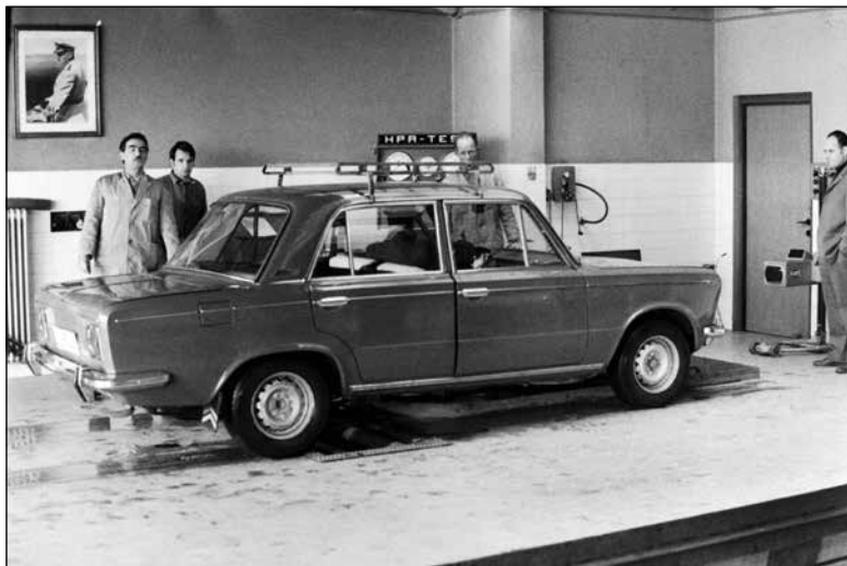
Tehnični pregled avtomobila v Ljubljani leta 1975

tako, pa obleke. Jaz pa čisto, čisto, čisto nič. Ker sem si tako grozno želela, da bom čim prej do avta prišla. In takrat sem si jaz kupila novega fičota, da sem se jaz peljala potem z avtom domov, da me ni bilo strah.« 786