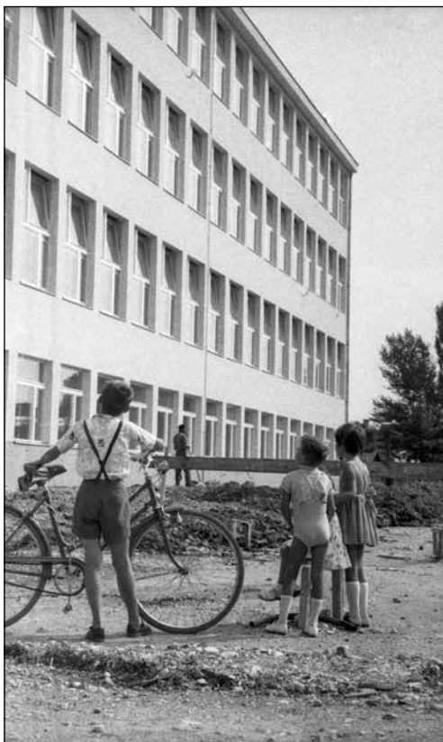
Nova osnovna šola v Trnovem (oktober 1962)

zaradi hitre in nenačrtne rasti naselij. Na eni strani so se morali lotiti urejanja kanalizacije, vodovoda, električnega in cestnega omrežja, na drugi sta velik naravni prirastek in sprememba v načinu življenja povzročila občutno pomanjkanje kapacitet v šolah in vrtcih. Medtem ko matere v mestu niso imele več družinskega zaledja, ki bi pomagalo pri varstvu otrok, saj je bilo veliko družin priseljenih, so na podeželju v sedemdesetih letih še vztrajale tradicionalne družinske funkcije, vendar so jih postopoma začeli prevzemati vrtci in šole.