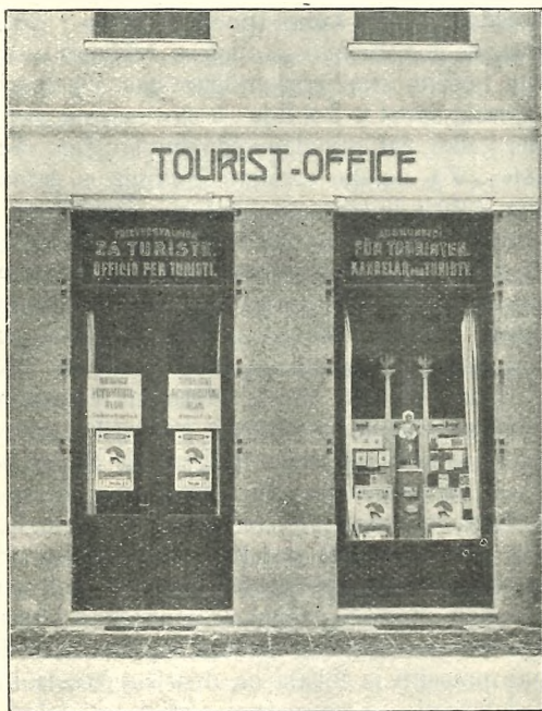
Tourist-Office na Miklošičevoj cesti br. 8 (1910—1915).