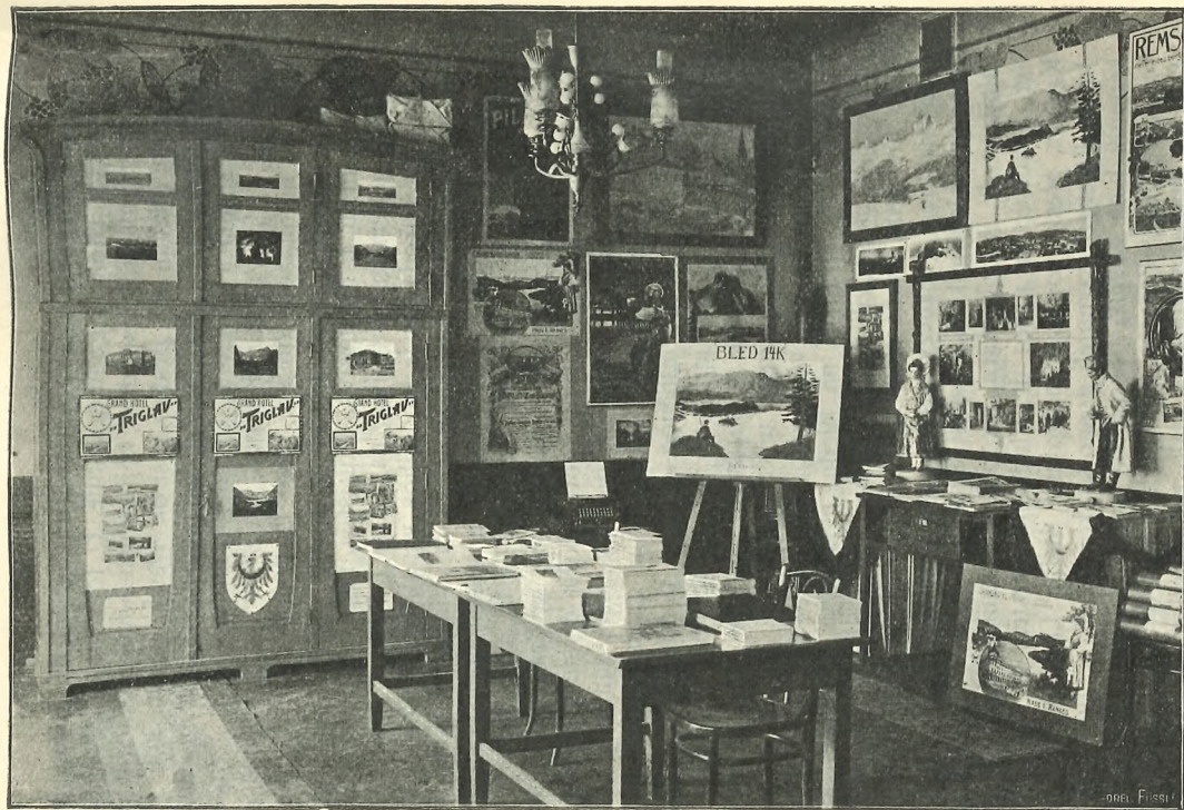
Unutarnjost prve pisarne Saveza god. 1907.