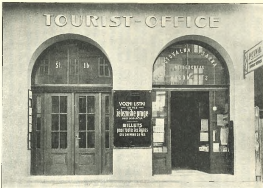
Tourist-Office na Dunajskoj cesti u palati Ljubljanske kreditne banke god. 1925.