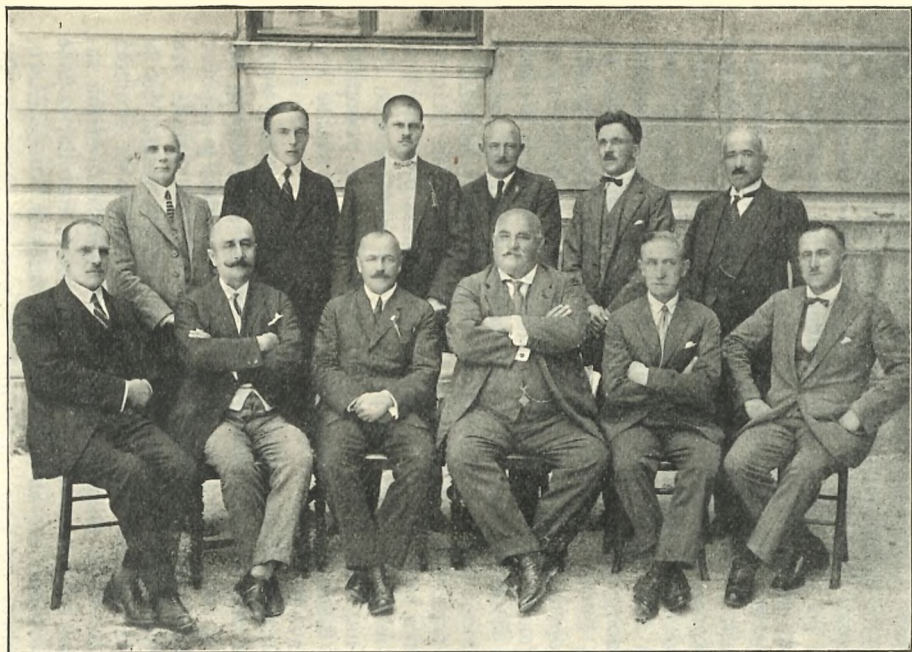
Odbor Saveza za promet stranaca u Sloveniji god. 1925.