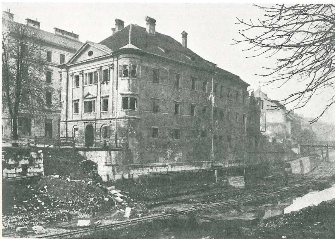
Obrežje Ljubljane od Brega proti Čevljarskemu mostu z Obrezovo hišo pred porušitvijo, MALj, Foto II/4

novi zunanji lice, načrt kaže, da bi dobila secesijsko fasado. Tedaj je občinski svet spremenil svoj nekdanji sklep o stavbni črti na nabrežju in načinu zazidave. Zahtevo po arkadah je opustil; da bi pridobil za promet dovolj široko komunikacijo, je stavbno črto premaknil za tri metre proti zahodu in tako dosegel za nabrežje širino 8 m, kolikor je bila določena tudi že pri nekaterih drugih hišah na današnjem Hribarjevem nabrežju. Projektirane arkade so bile opuščene zato, da bi bilo celo nabrežje enotno urejeno. Tudi v Čevljarski ulici je bila določena nova stavbna črta in sicer tako, da bi bila ulica 10 m široka. S tem sklepom je občinski svet spremenil regulacijski načrt glede nabrežja Ljubljane in Čevljarske ulice ter si je za to spremembo preskrbel odobritev deželne vlade. 7 Hišni lastnik, ki je hotel sprednji trakt hiše ohraniti, ni sprejel pogojev občinskega sveta, tudi glede odškodnine za zemljišče, ki bi ga moral odstopiti mestu za razširitev nabrežja in Čevljarske ulice, ni prišlo do soglasja. Zoper odklonitev dovoljenja po magistratnem gremiju je Lilleg vložil pritožbo na občinski svet. Stavbni odsek je — ker se Čevljarska ulica po njegovem mnenju v bližnji bodočnosti ne bo regulirala — priporočal dovoljenje za prezidavo. Temu