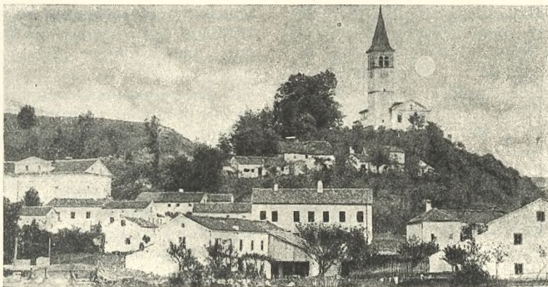
Župna cerkev v Trnovem

Po Salomovi odpovedi so se pričeli za prosto župniško mesto potegovati številni pro-