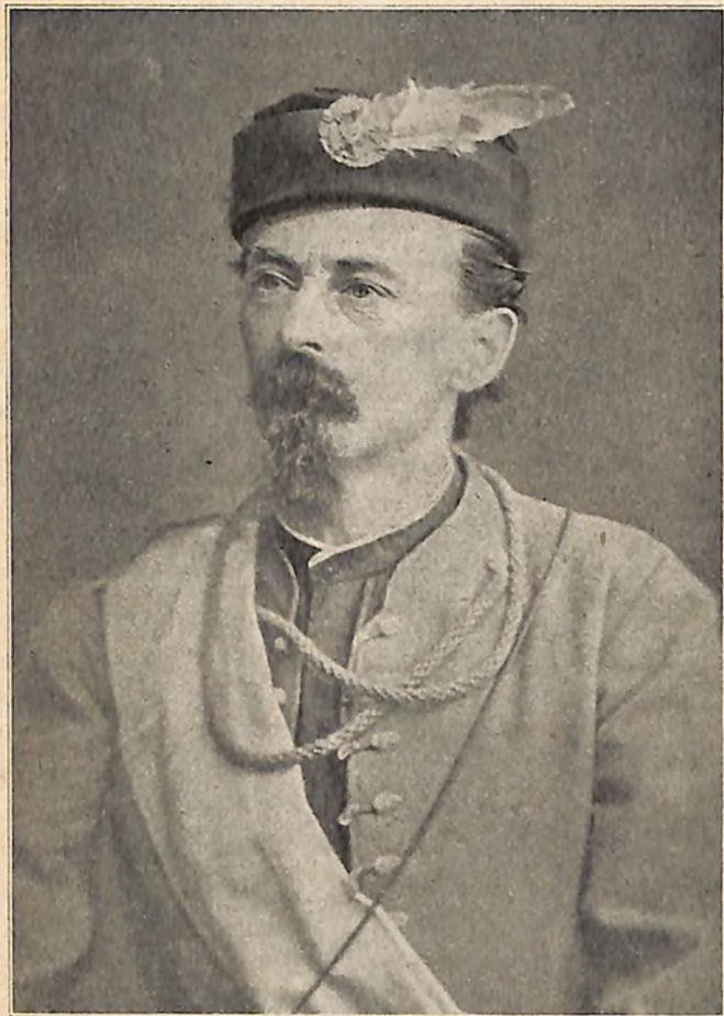
Dr. Miroslav Tyrš (Poslednja fotografija v kroju)