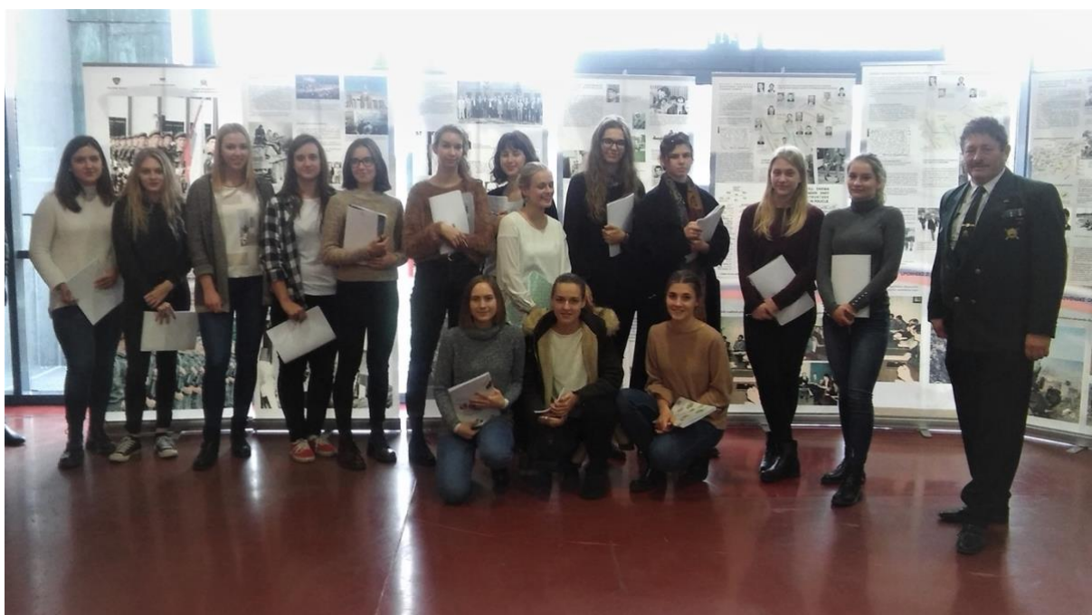
Slika 8: Predavanje o dogodkih iz leta 1990–91 za dijake Gimnazije Ptuj, 17. november 2017.