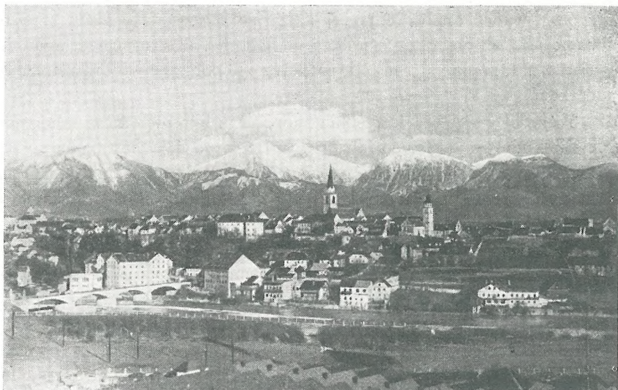
Pogled na Kranj okoli leta 1930

tako pridobili postranski zaslužek. Glede dejavnosti kajžarjev in gostačev nam popisi povečini ničesar ne povedo; izjema je popis za preddvorsko župnijo, kjer so številni kajžarji in gostači označeni tudi kot rokodelci.