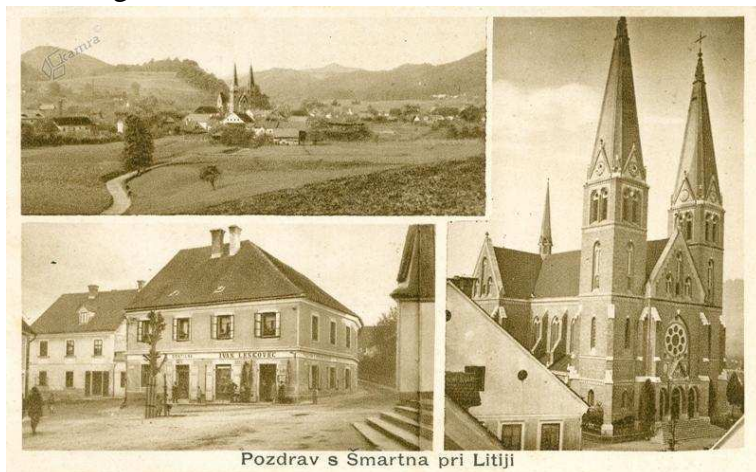
Slika 2: Šmartno pri Litiji leta 1929 334

V zvezi z zdravniško oskrbo v Šmartnem pri Litiji se omenjajo Ukmar, Premrov in Lebinger. 333