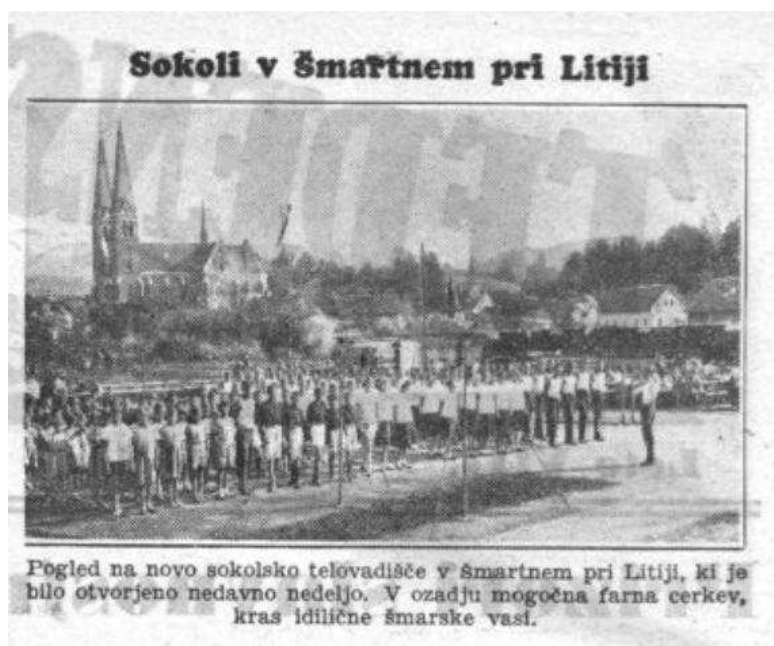
Slika 5: Sokoli v Šmartnem 1116

V okviru sokolskega društva je deloval tudi dramski krožek. Skozi vse leto so prirejali igre, pozimi pa tudi plesne vaje s plesnim venčkom. Tudi Katoliško prosvetno društvo je redno prirejalo igre. Od leta 1918 naprej naj bi v Prosvetnem društvu vsako soboto ali nedeljo prirejali razne igre (Luč z gora, Magdina žrtev, pravljica Valjavčev Prstan ...) in tekmovali z dramskim krožkom Sokolov. 1112 V zimskem času sta obe dvorani, posebno pa društvena, privabljali domače in tudi bolj oddaljene gledalce. Med seboj so tekmovali, dobre igre so pa tudi ponavljali. 1113 Ohranjen je tudi spomin na igre: »Punce smo rade hodile v Šmartno gledat igre. Igrali so vsako nedeljo, enkrat v društvenem domu, drugič v Sokolskem. In smo šle. Občudovale smo Brajdatove fante. Fejst fantje in pravi igralci, pa tudi odlični telovadci. Enkrat smo šle celo v Kostrevnico, igrali so Prisega o polnoči. Pa smo se res pozno vrnile domov, je bil ogenj v strehi.« 1114 Tudi za Miklavža sta obe društvi, Sokol pri Leskovcu in Orel v dvorani, pripravila svoje praznovanje. 1115