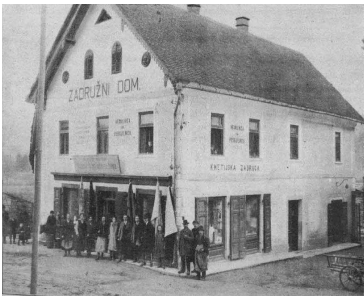
Slika 3: Kmetijska zadruga v Šmartnem pri Litiji leta 1925 439