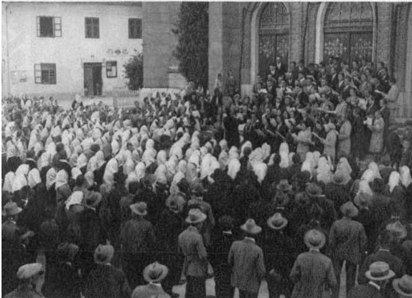
Slika 4: Cerkveni koncert pred cerkvijo v Šmartnem pri Litiji ob priliki marijanske slovesnosti leta 1931. 754