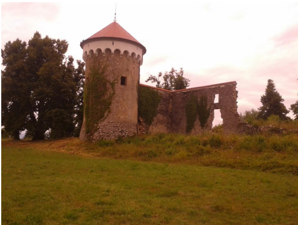
Slika 5: Podoba gradu Kalcu danes.

Danes prostor, na katerem je potekal veličastni shod, na obiskovalca zagotovo ne naredi nobenega vtisa. Okolica ruševin je zapuščena in se počasi zarašča, kljub temu da bi lahko prizorišče učinkovito izkoristili turistični delavci in ga vključili v turistično ponudbo Pivke.