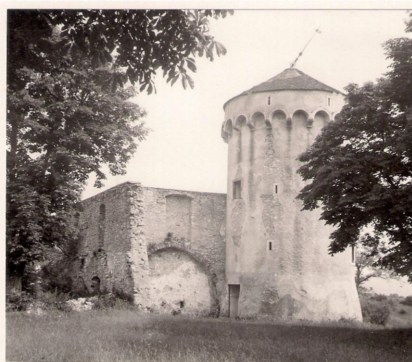
Slika 1: Ruševine gradu Kalec v petdesetih letih 20. stoletja

O obstoju gradu na tem mestu danes pričajo le še ruševine, svojo prvotno podobo ohranja zgolj še okrogli obrambni stolp s strelnimi linami in obrambnim hodnikom na vrhu. 7