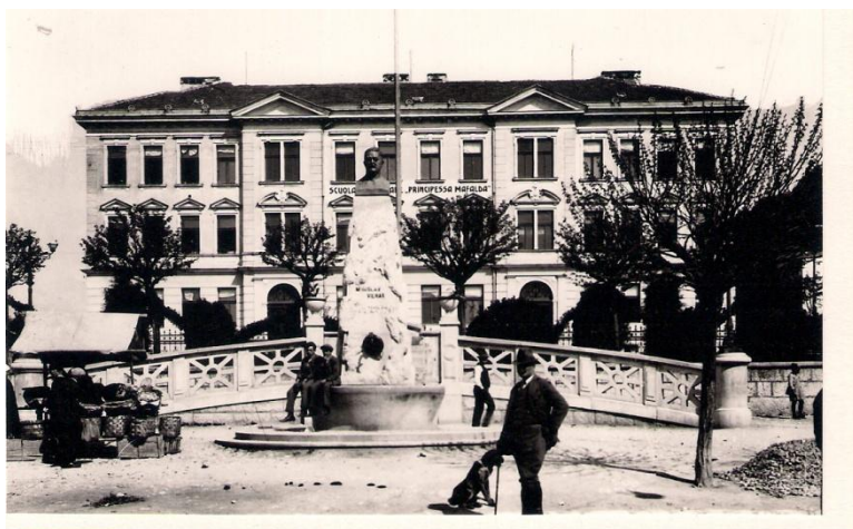
Slika 2: Prvi Vilharjev spomenik na osrednjem trgu v Postojni.

Leta 1920 je bila podpisana rapalska pogodba, ki je na novo začrtala mejo med Kraljevino Italijo in Kraljevino SHS. Pivška kotlina je tako postala del Italije, kjer se je začel vzpon fašizma. 18. aprila 1926 so se nad Vilharjevim spomenikom znesli fašisti in ga premazali s črno barvo. Drugič so se spomenika lotili 5. oktobra 1941, ko so ga povsem razdejali. 21 21. maja 1995 so na starem mestu postavili nov spomenik, delo kiparja Batiča. 22