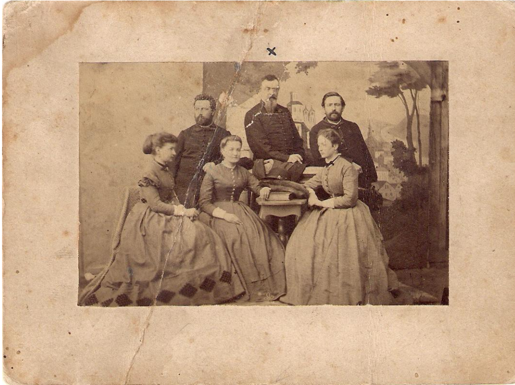
Slika 3: Družina M. Vilharja