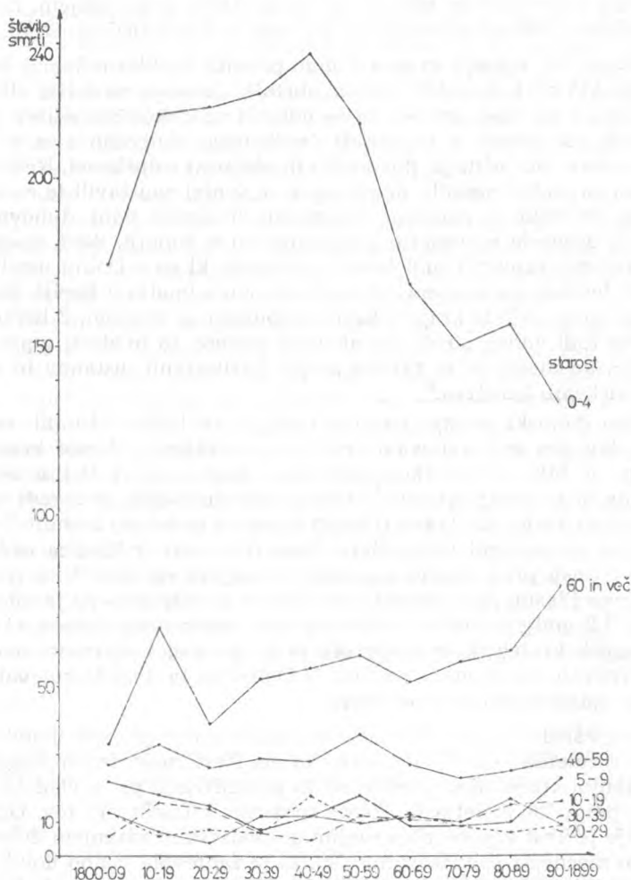
Grafikon št. 2: GIBANJE SMRTNOSTI PO STAROSTNIH SKUPINAH v 19. stol.

razslojevanja in ki je obubožan zapuščal svoj rojstni kraj v iskanju večjih možnosti preživetja. To so bili člani skupnosti, ki so že v prvi polovici 19. stoletja doživele močan demografski porast, ki so bile preoddaljene od prometnic in urbanih naselij, da bi lahko poleg kmetijske panoge izkoriščale druge pridobitvene vire. Dolina pa je kljub skromnemu gospodarstvu marsikomu ponujala, pa čeprav le za kratek čas, možnost preživetja ali pa mu vsaj omilila lakoto.