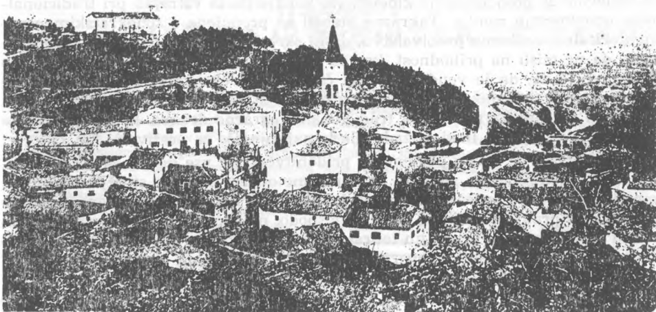
Dolina v začetku 20. stoletja

(iz knjige Pozdravi iz slovenskih krajev: dežela in ljudje na starih razglednicah , Ljubljana 1987)