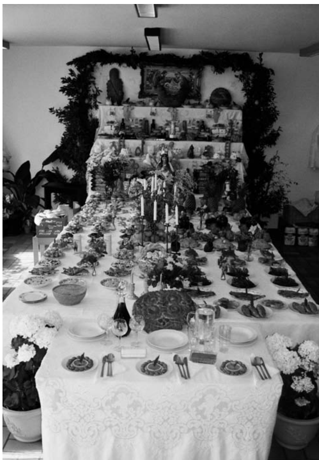
Photograph 1: Banquet of St Joseph in the rooms of the Missione Cattolica Italiana , Sindelfingen, 2004 (Photo: Emanuel Valentin, 2004)

In the week before the 19 th of March Maccarísian women start with the preparations for the St Joseph altars. These altars, which are erected in different households, are large banquets: big tables are covered with a huge amount of comestible goods like fresh and dried fruits; raw, cooked and partly wild vegetables; fish, flour, pasta, and so forth. Most of these goods are ordered by a transport company, which brings them directly from Sicily. This is necessary because some goods like the wild vegetables or the big laurel branches for decoration can't easily be found in Germany or "just taste better". Next to these foods, which my informants understand as "traditional" and "poor" ("St Joseph was poor.") foods,